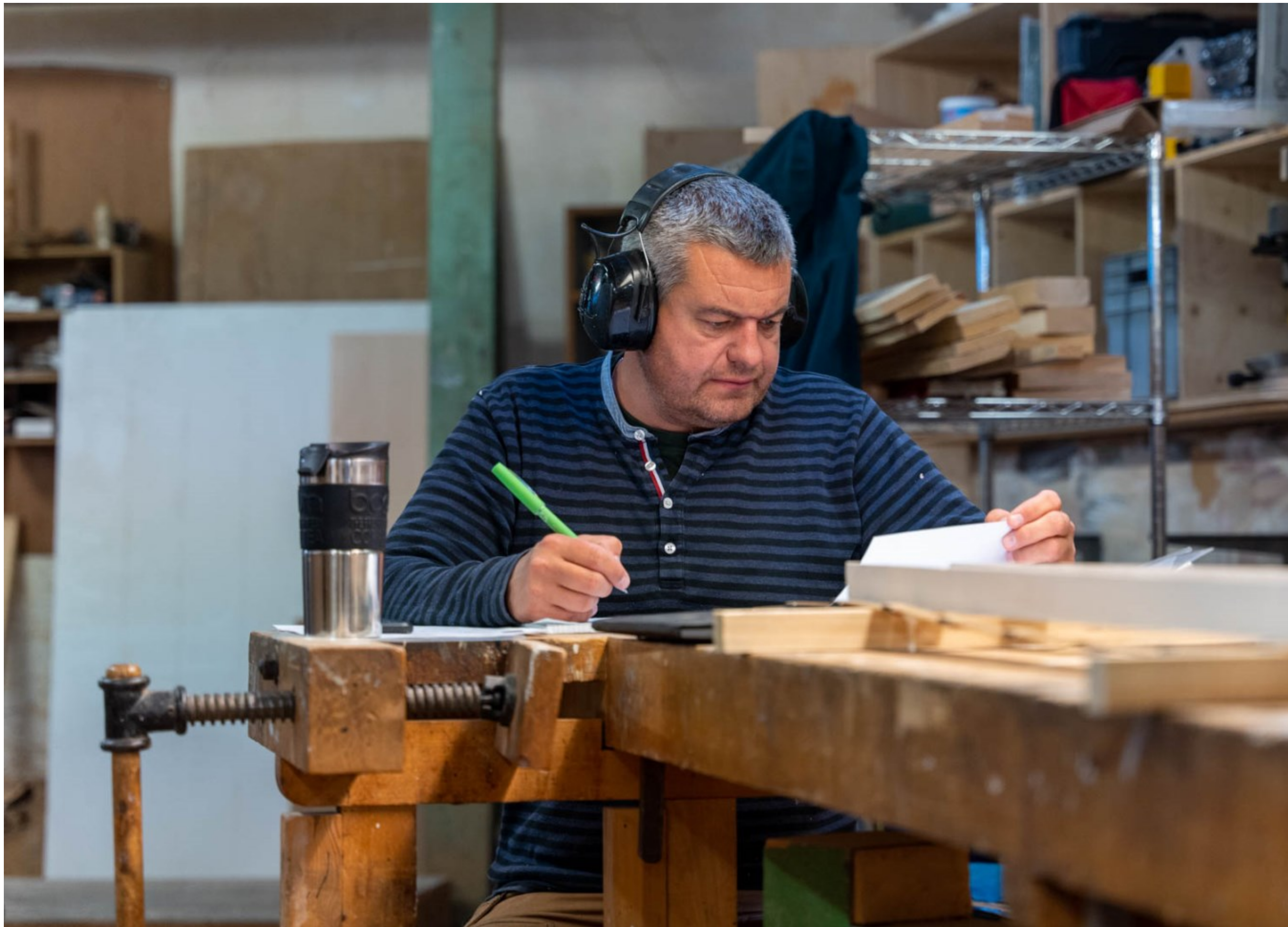
Top og nederst til højre: Kl. 08.15 + 08.25.

På Rammelisten, det mere end 120 år gamle snedkeri, løser snedkere opgaver og arbejdsskemaer opdateres. Helsingør Rammelistefabrik & Maskinsnedkeri ApS., Helsingør