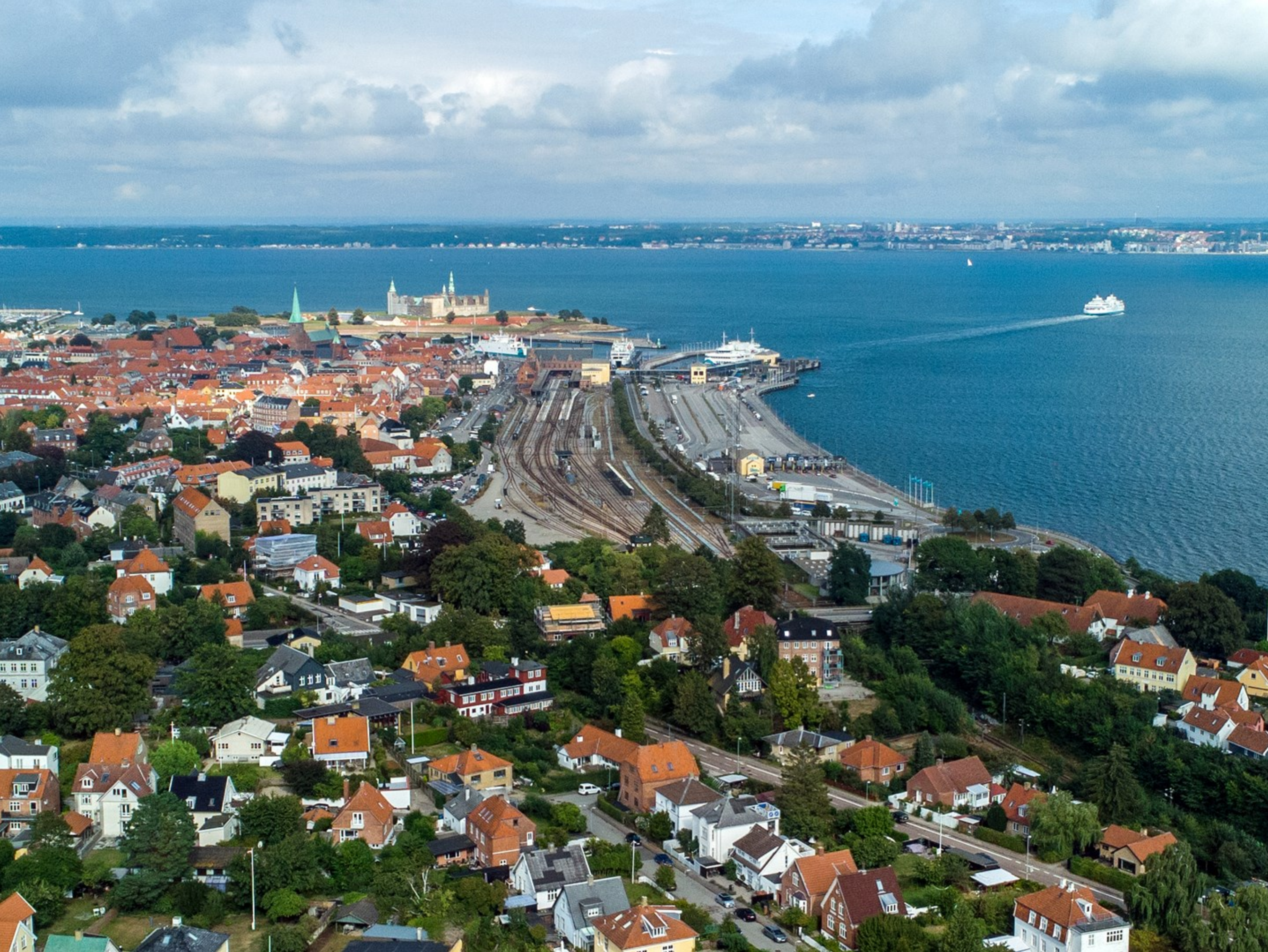
Helsingør by set fra oven Kl. 15.06.