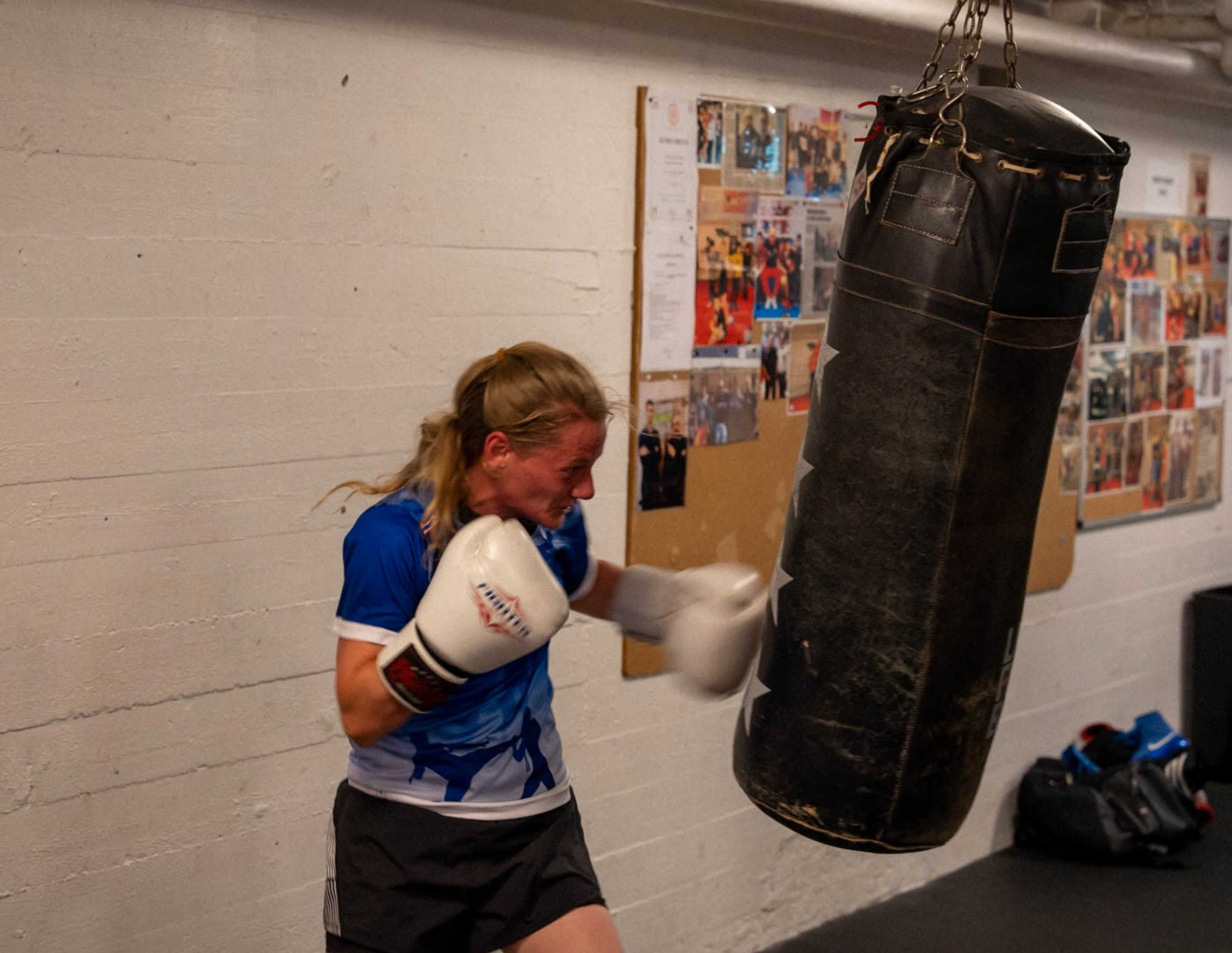
Boksetræning, Værestedet Tetriz, Helsingør Kl. 16.51, Foto: Svend Erik Ladefoged