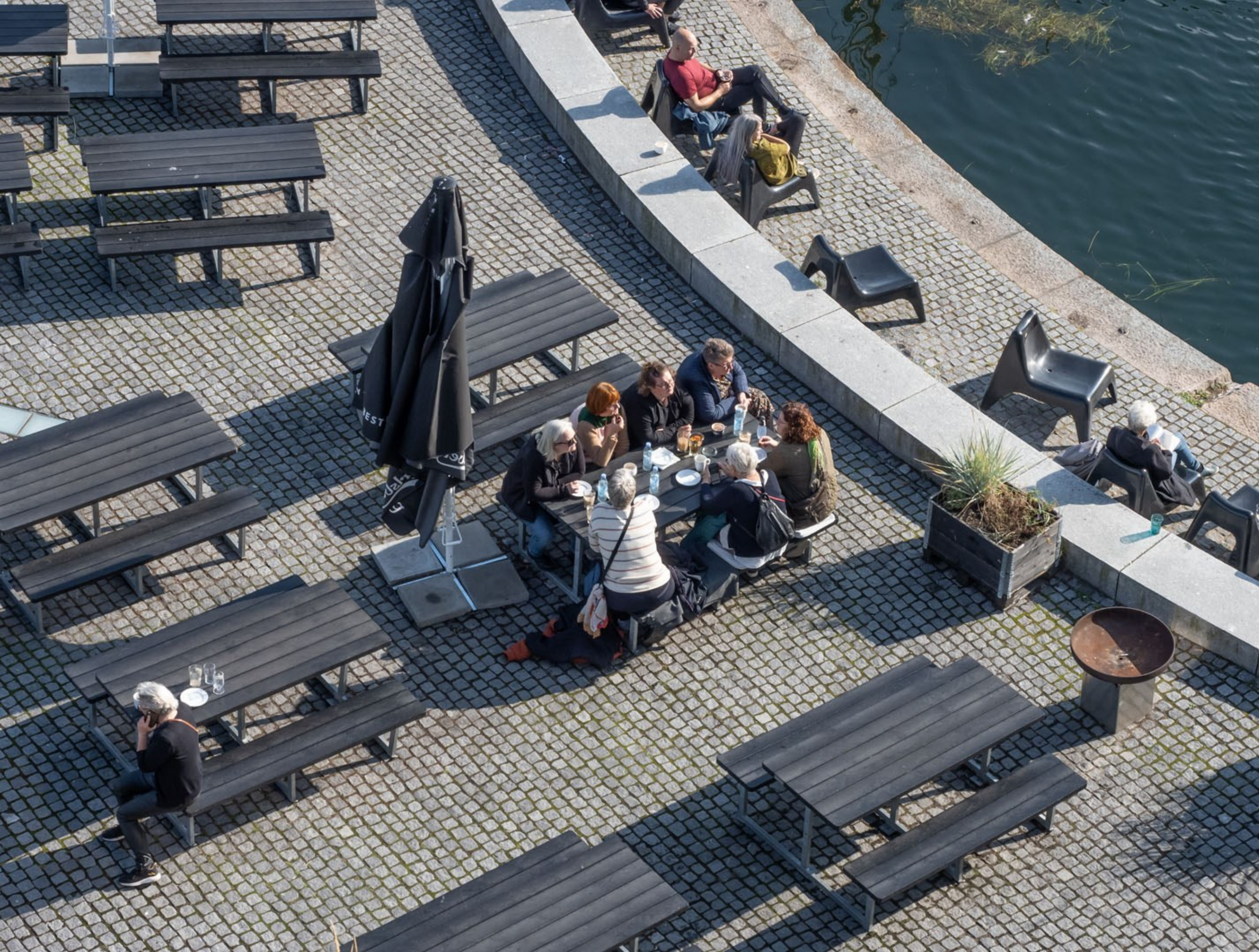
Havnefronten foran Kulturværftet, Helsingør Kulturværftet. Kl. 14.55.