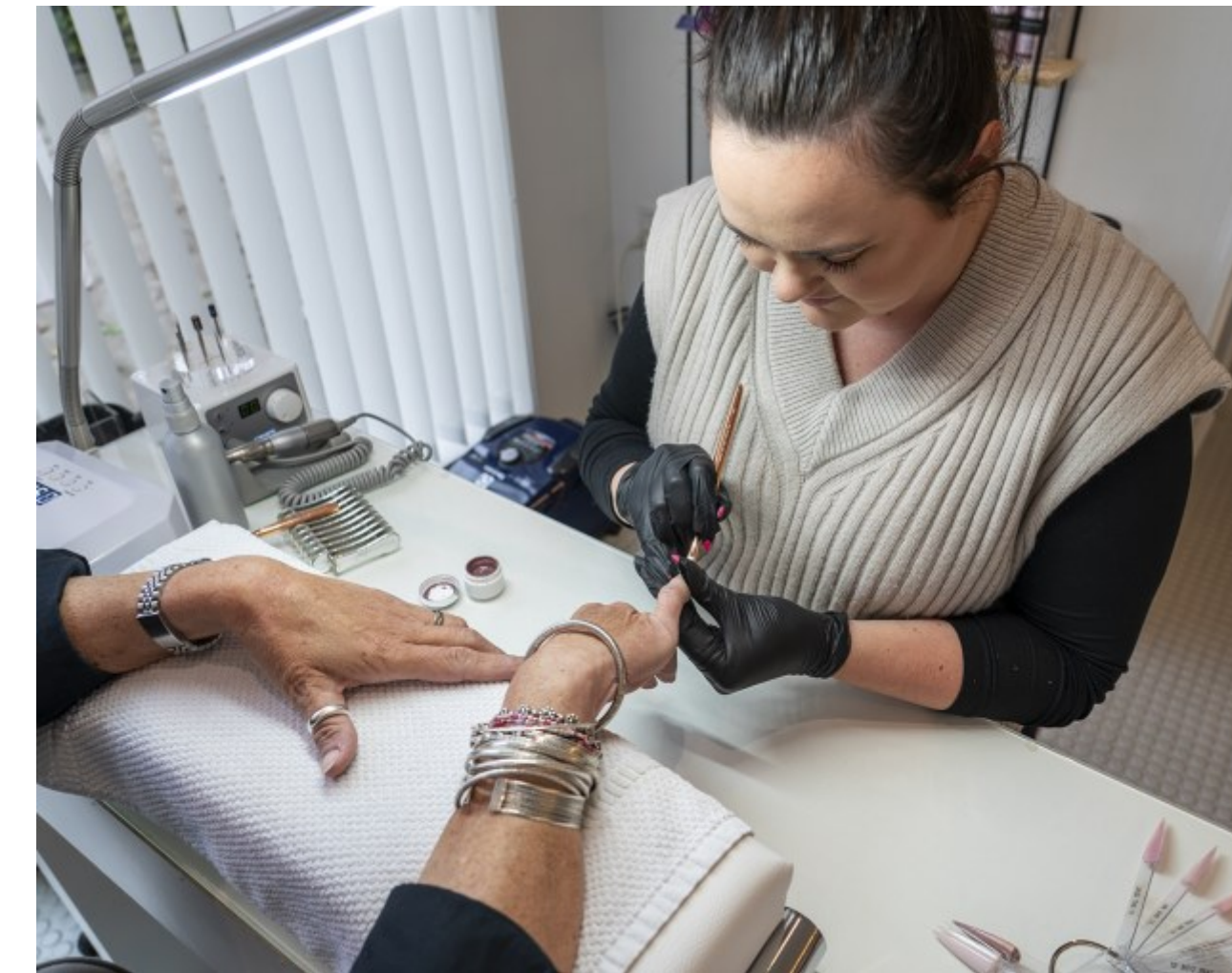
På vej til fine negle, Frisør Frandsen, Helsingør Kl. 12.36.