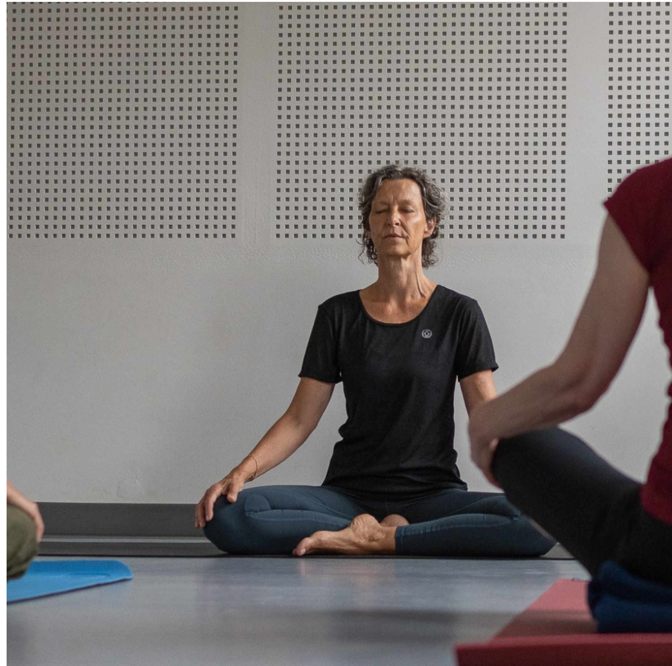
Yoga-hold i LOF-regi, Helsingør, Kl. 08.39