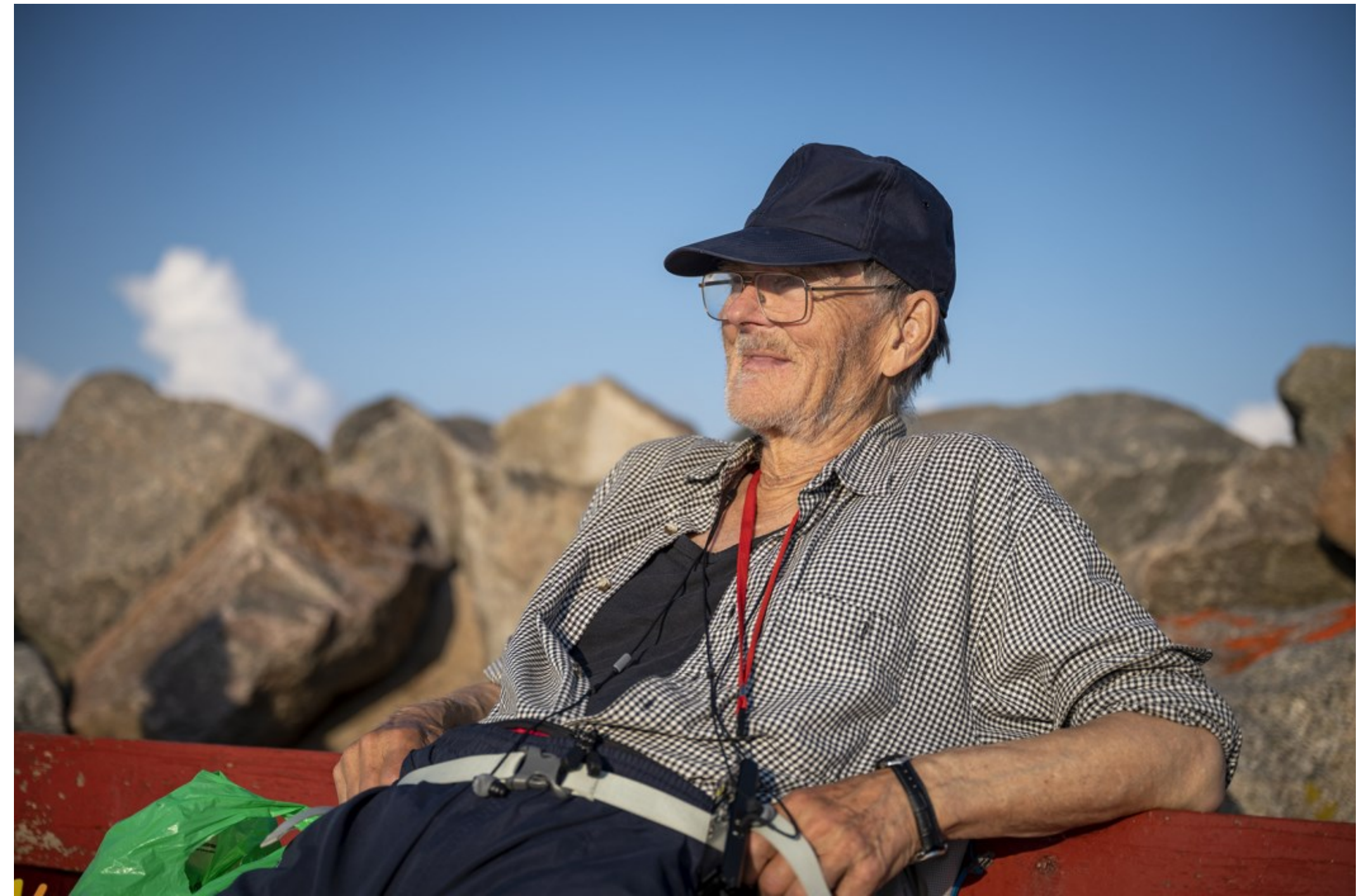
Den sidste svømmetur, Hornbæk Havn, Kl. 18.13 + 18.11, Fotos: Dani Håkansson