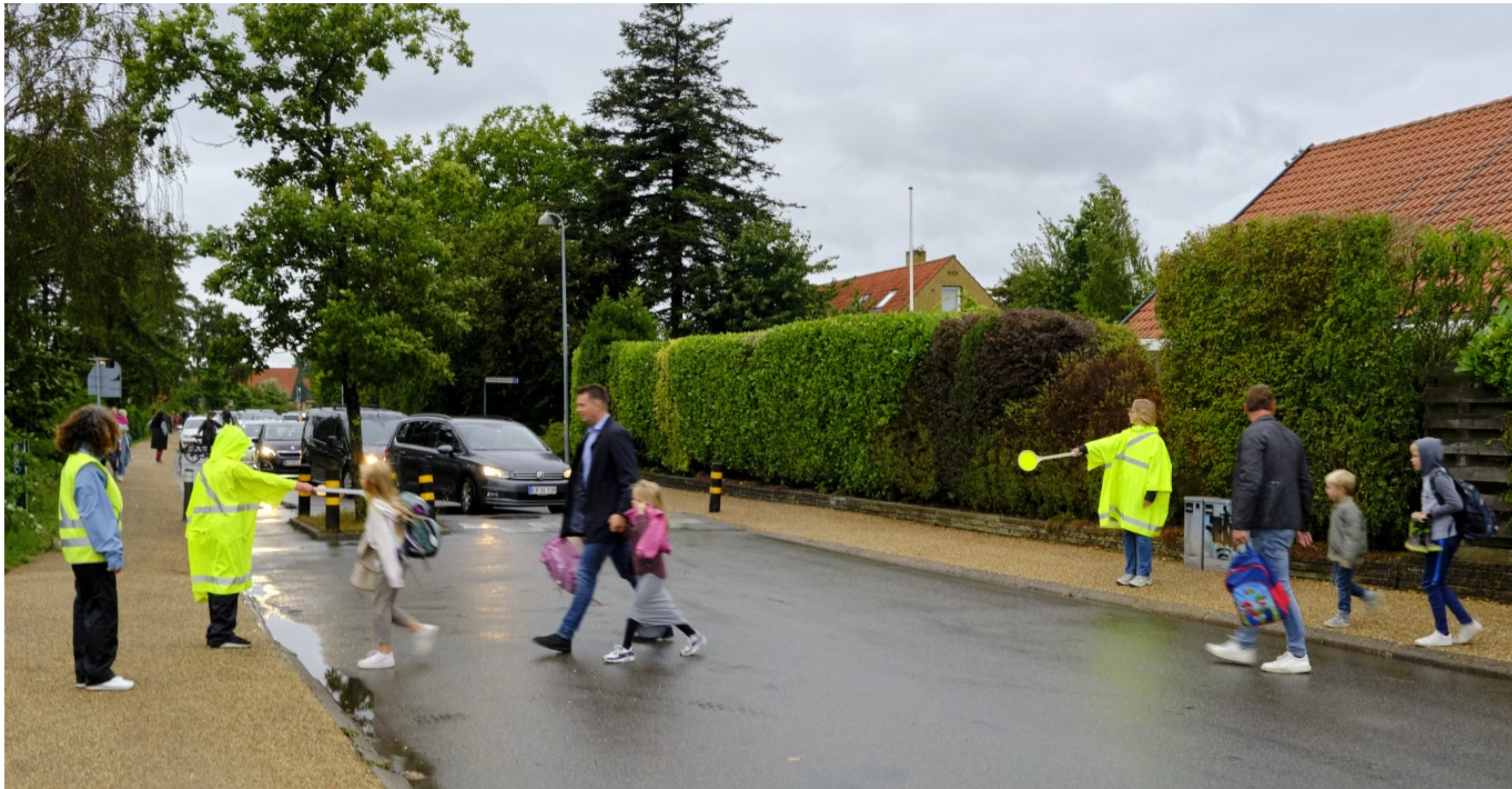
Skolepatruljen på Mørdrupskolen i aktion. Espergærde Kl. 07.58.