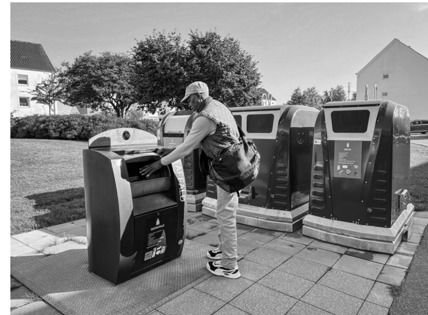
Blicherparken i Helsingør. Kl. 15.49

Blicherparken har affaldssortering så det er med at vælge den rigtige beholder. Restaffaldet skal i den rette beholder.