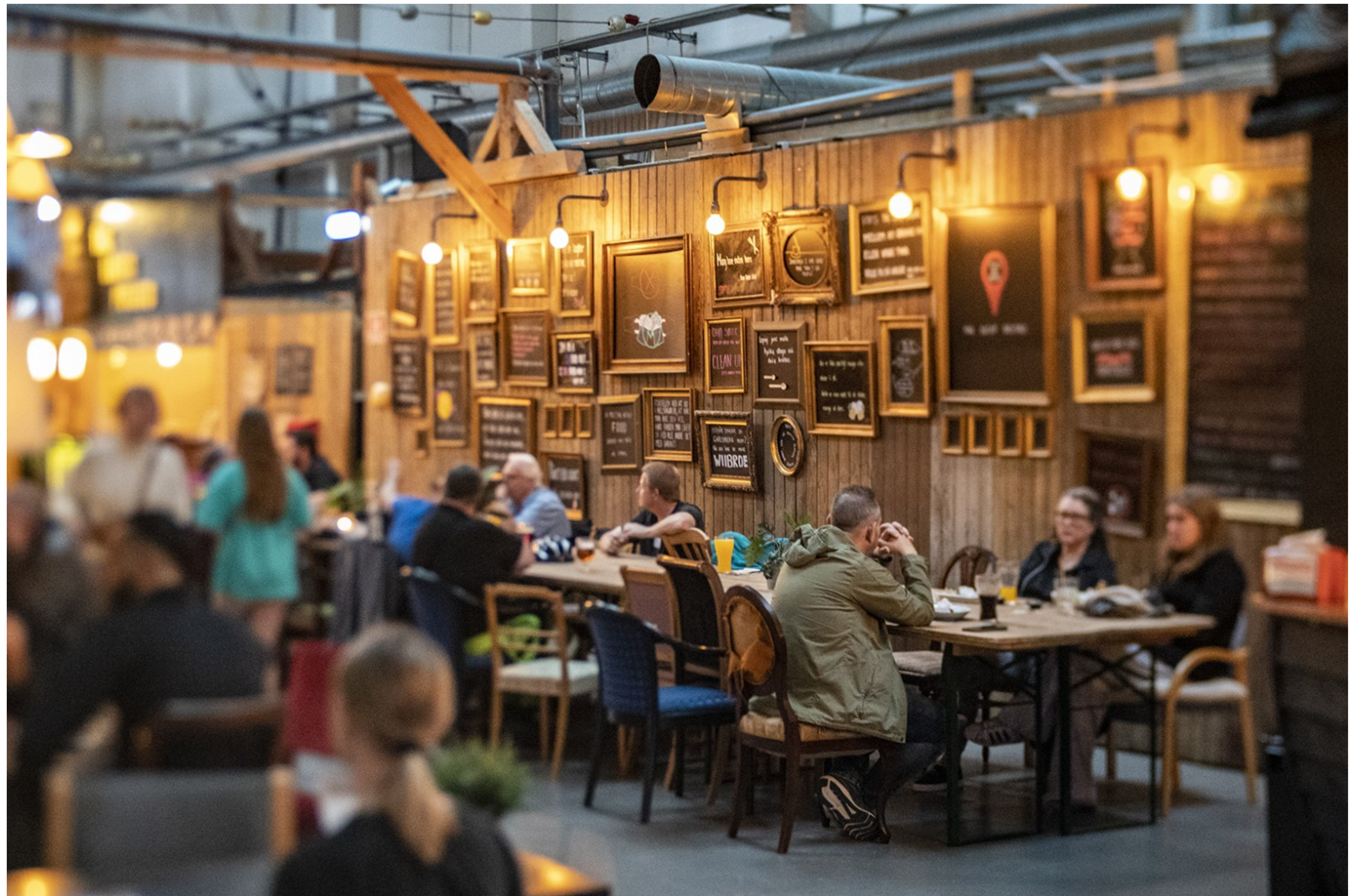
Hyggelig spiseplads Kl. 19.05.