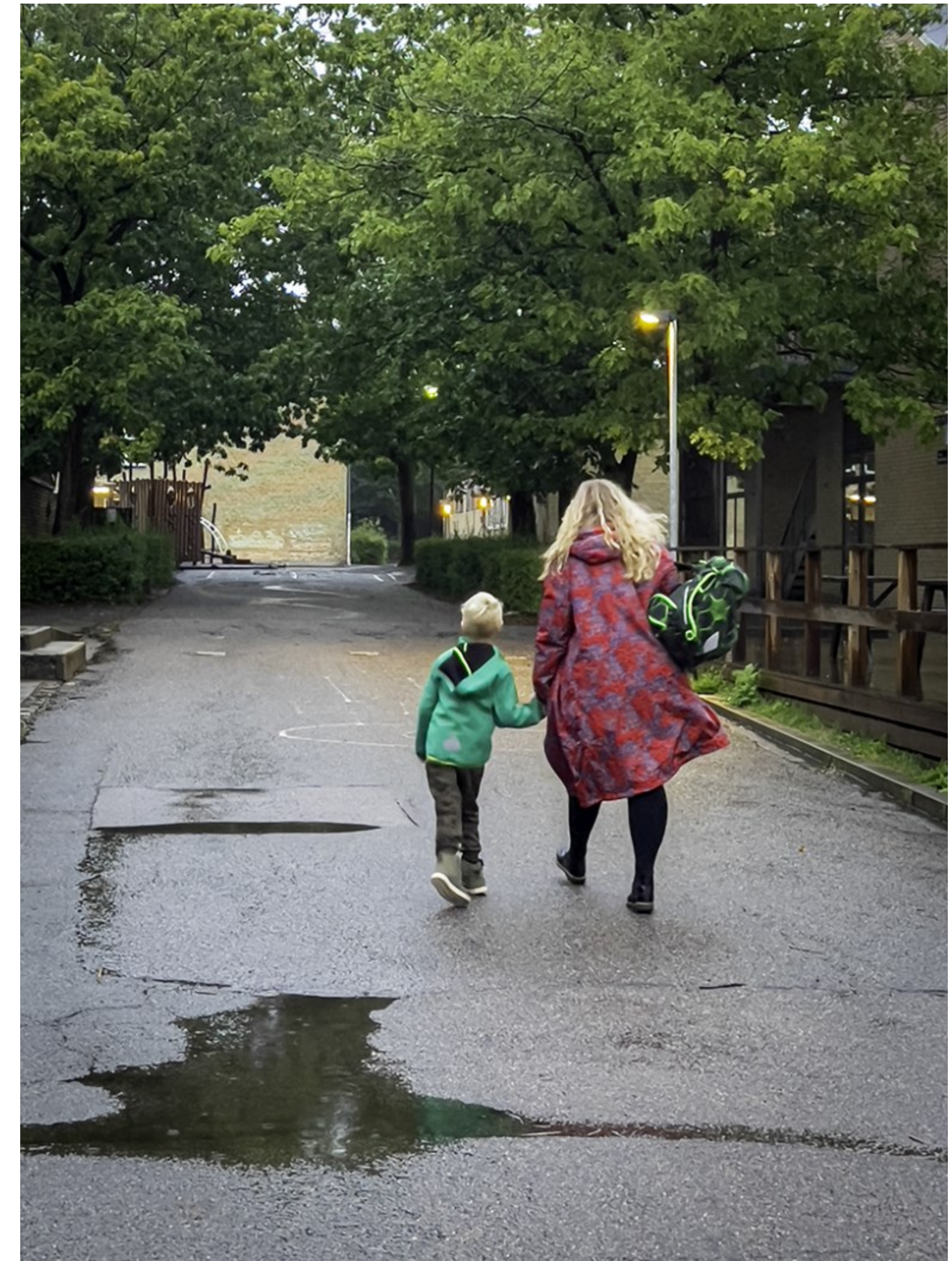
På vej ind i skolegården. Skolen ved Gurrevej, Helsingør, Kl. 07.00.