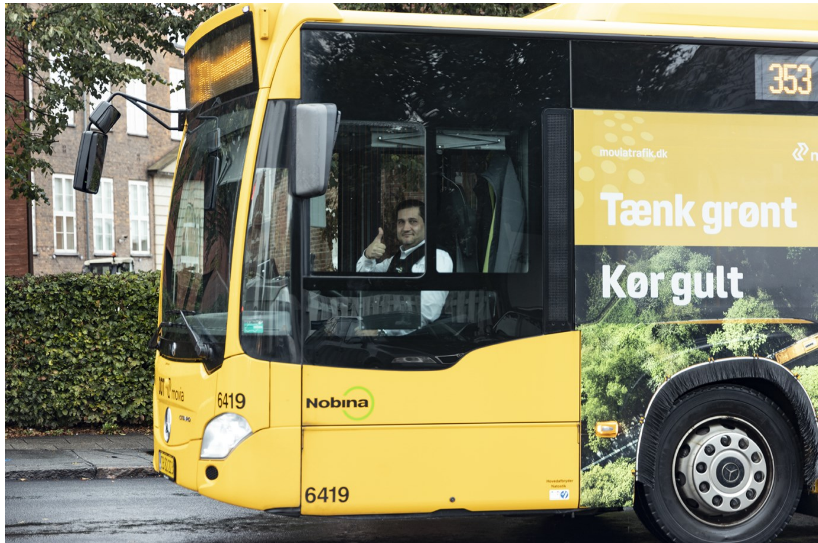
Buschauffør, Helsingør, kl. 08.59