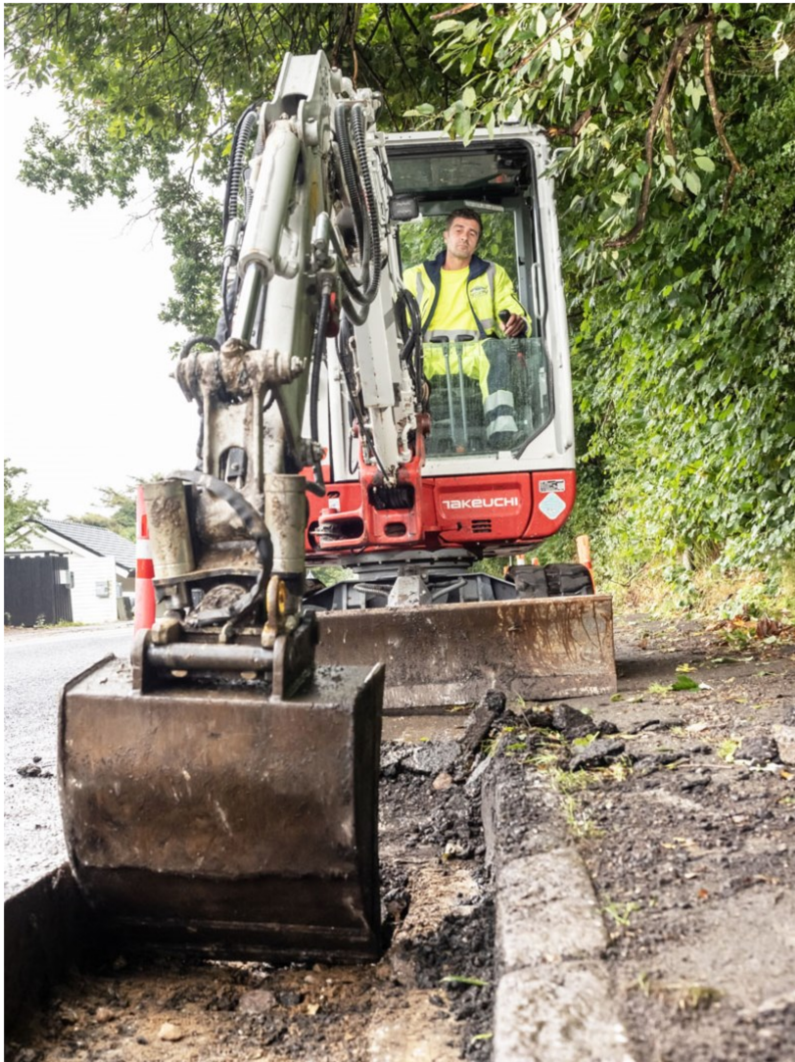
Kl. 09.43