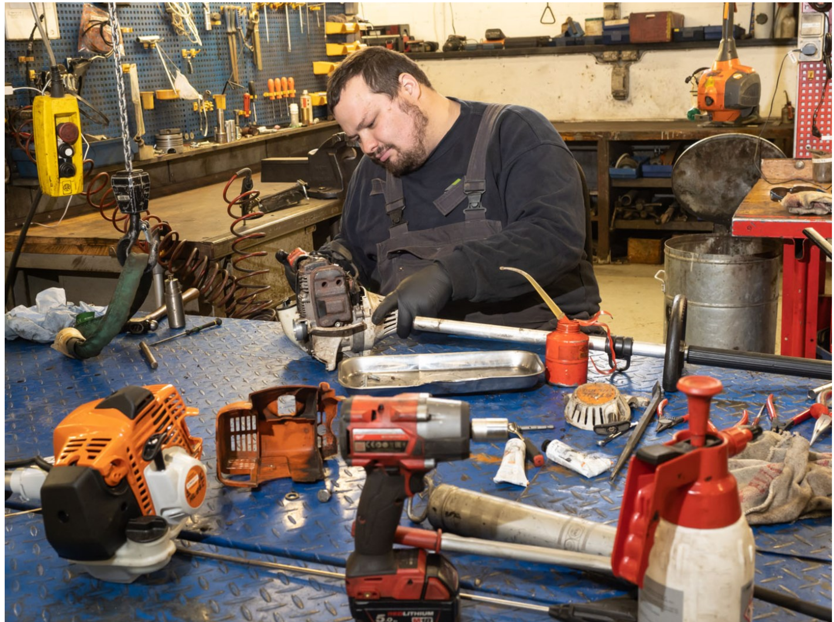
NSPV—materielgården, Helsingør, Kl. 10.58.