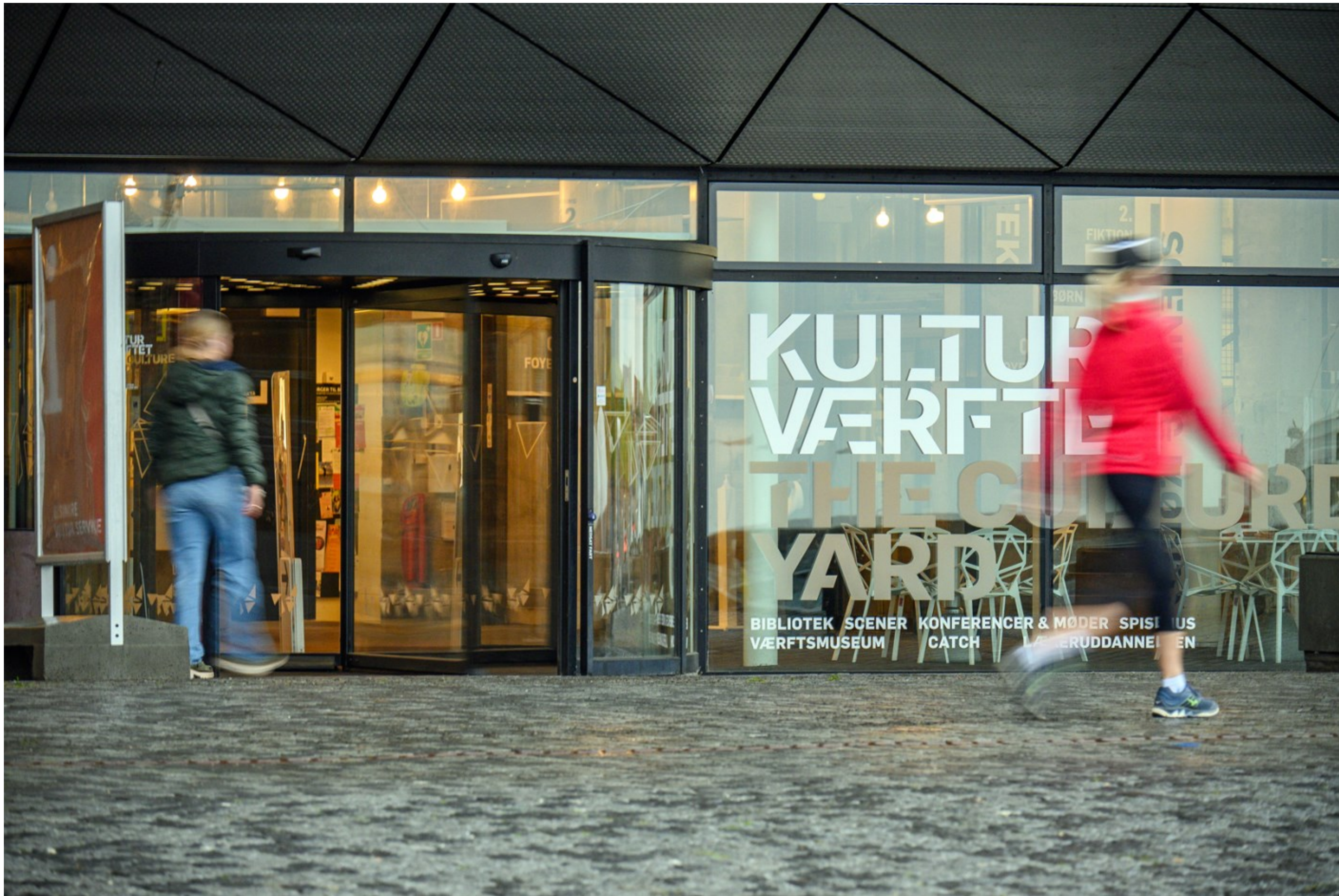
Lige inden åbningstid Kl. 08.01.