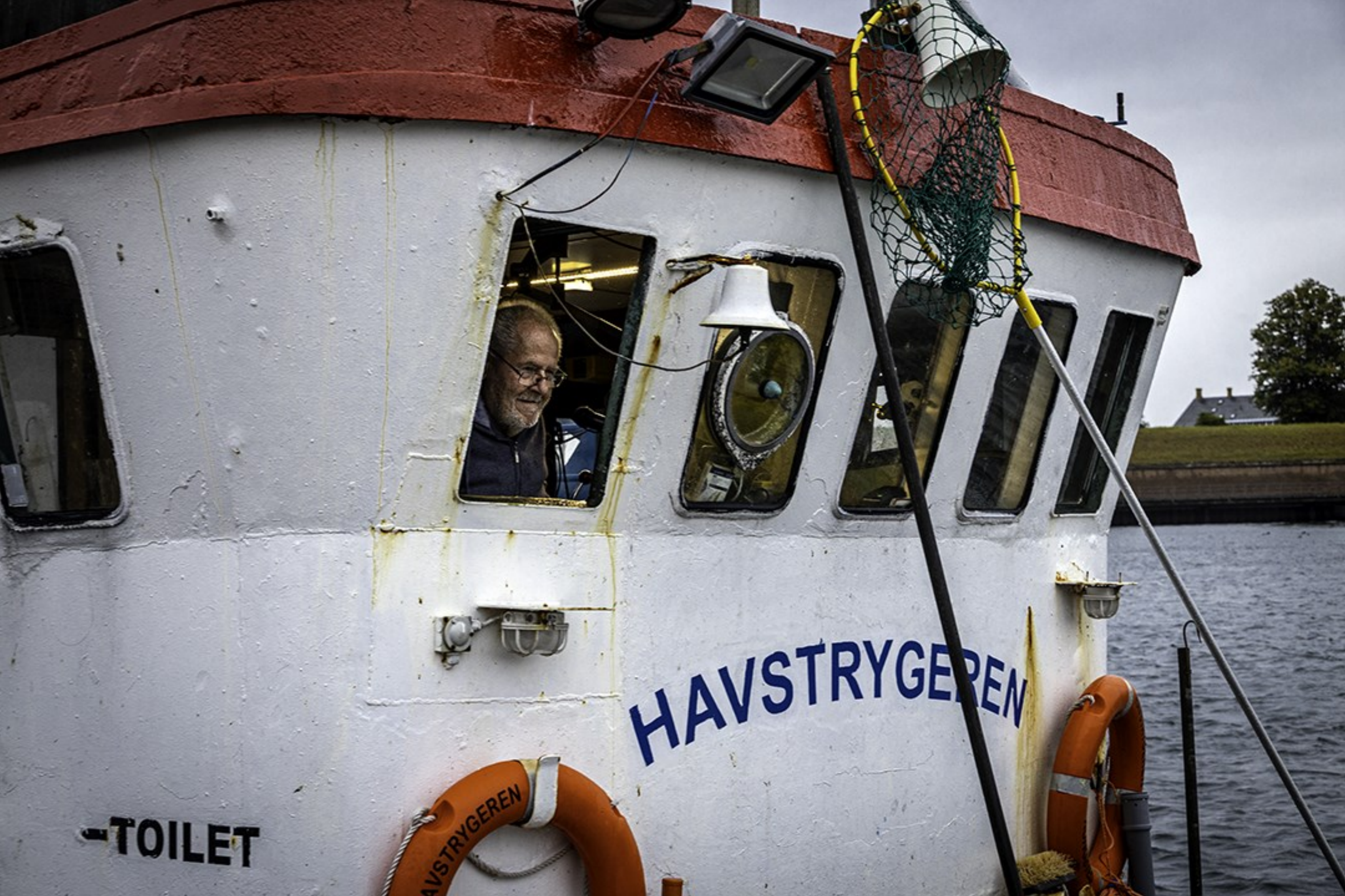
Havstrygerens kaptajn sikrer sig at alt er i orden før afgang fra Helsingør, Kl. 07.06.