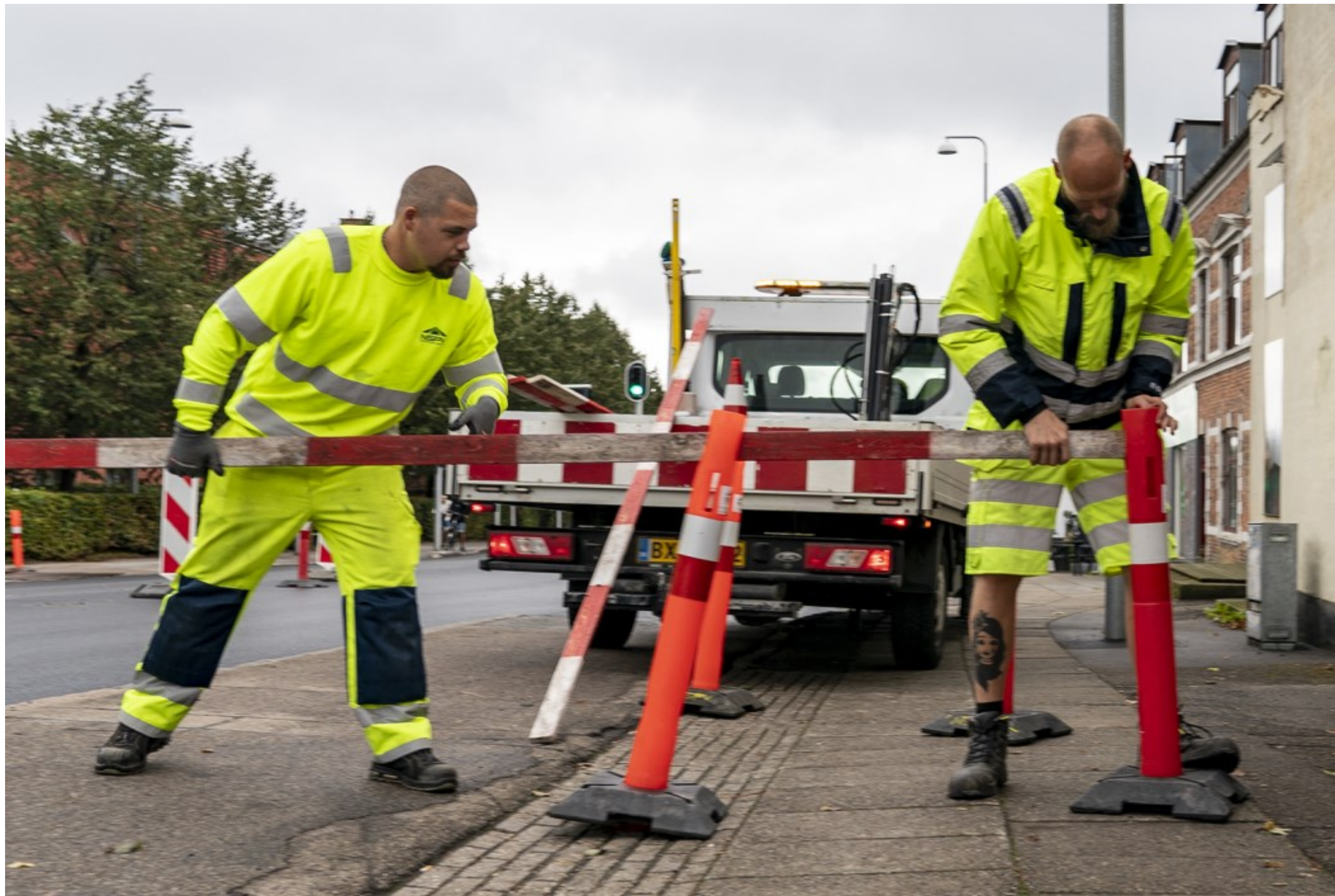
Kl. 12.18.