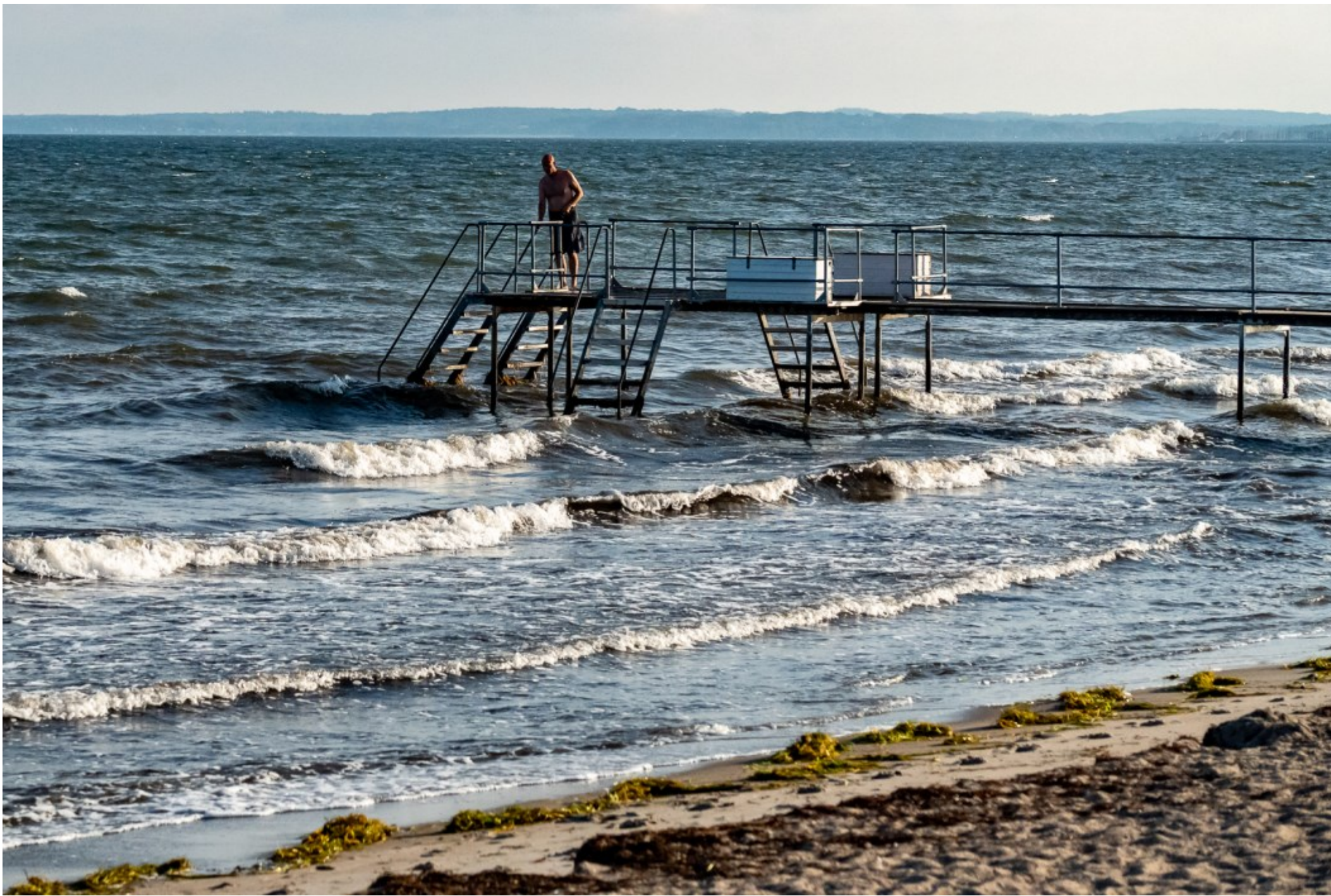
Sensommer badning ved Snekkersten strand Kl. 17.40