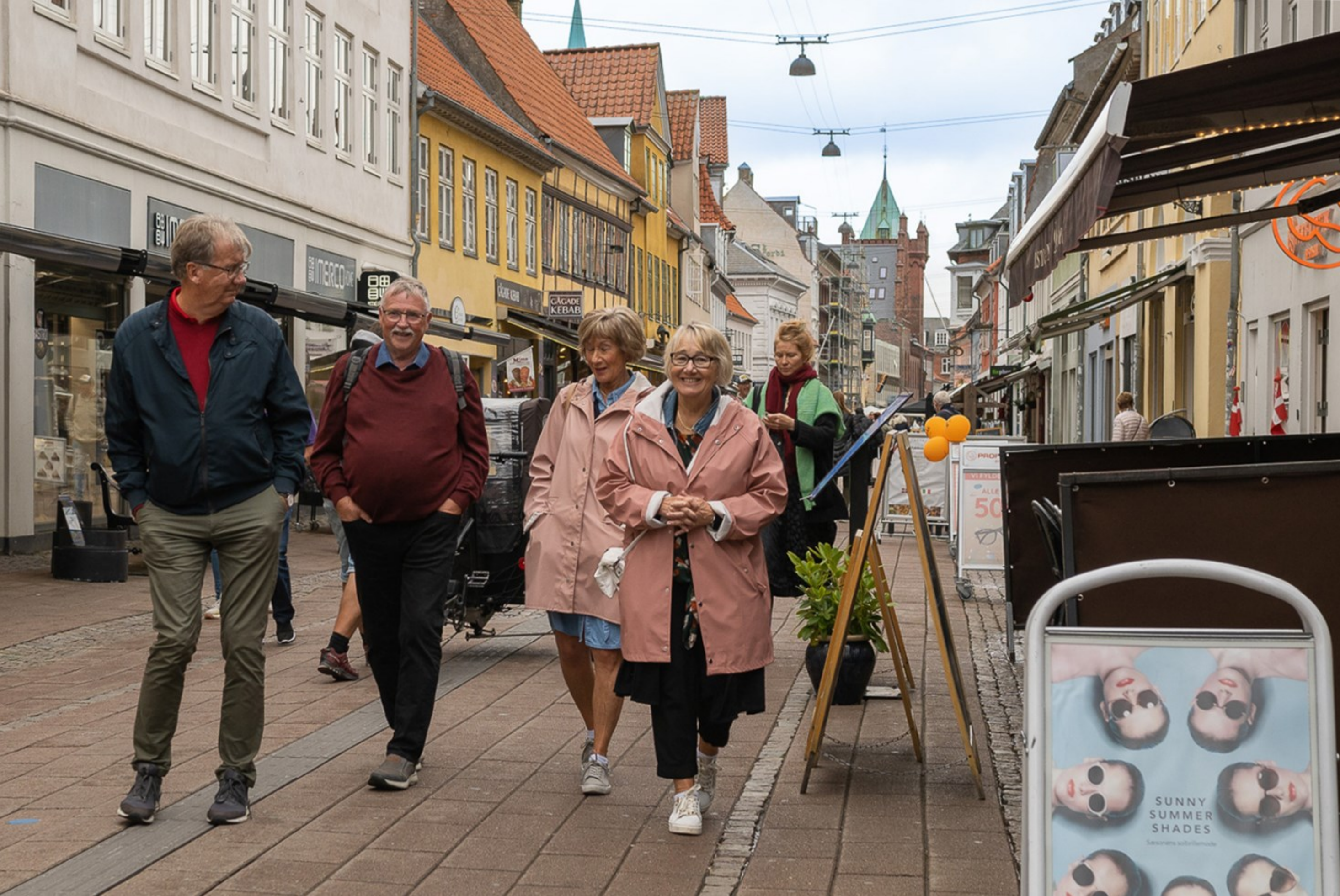
Svenske turister på strøgtur, Stengade. Helsingør KL. 12.06, Foto: Birgit Olsen