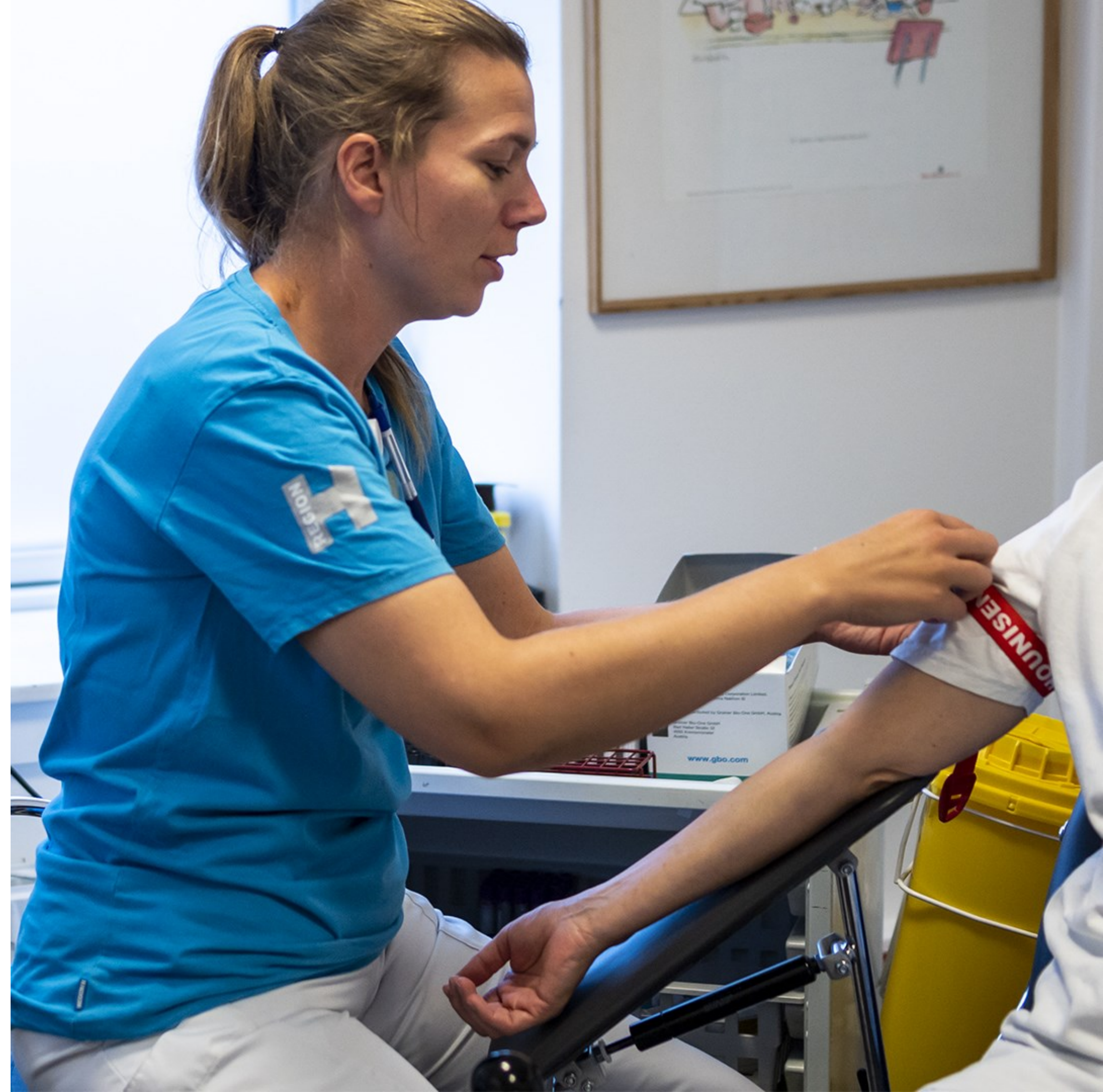
Blodprøvetagning i Sundhedshuset, Helsingør Kl. 11.54, Foto: Birgit Olsen