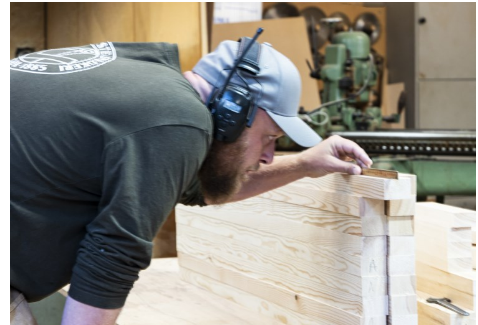
Øverst til højre: Kl. 09.30.

På Rammelisten, det mere end 120 år gamle snedkeri, løser snedkere opgaver og arbejdsskemaer opdateres. Helsingør Rammelistefabrik & Maskinsnedkeri ApS., Helsingør