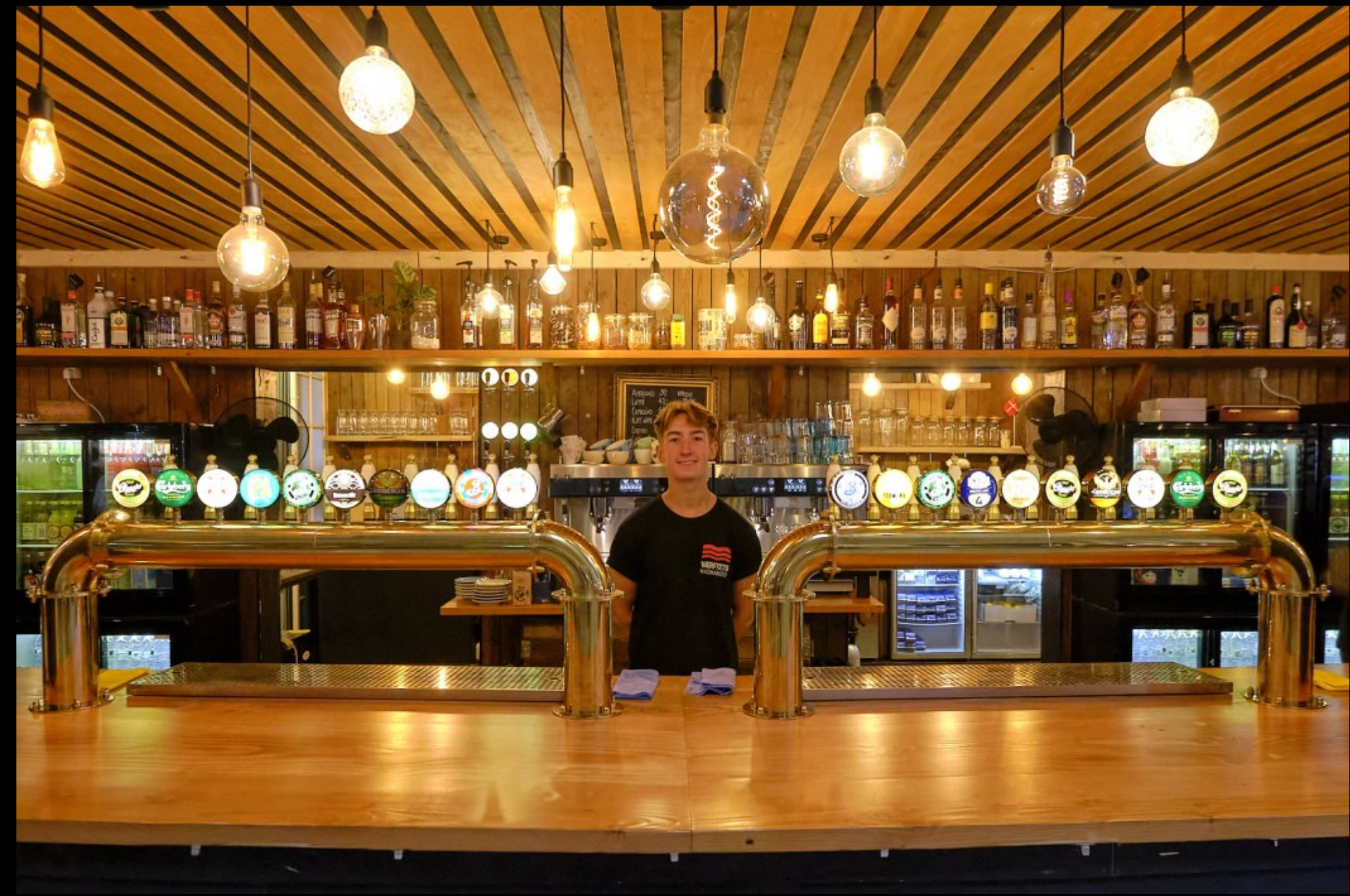
Madmarkedet Kulturværftet, Helsingør Kl. 12.03