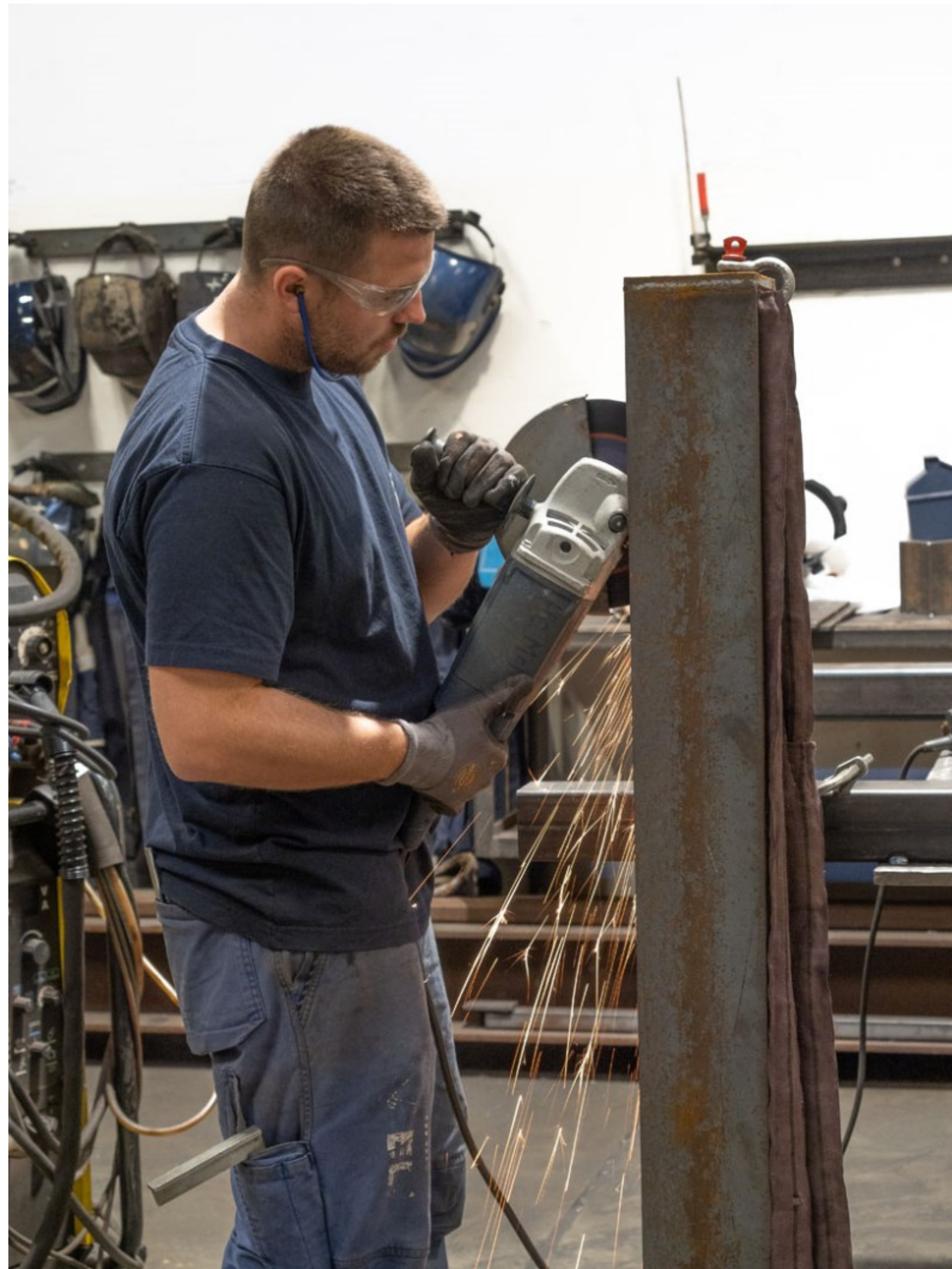
MOEL smedie, Kvistgård KL. 08.33 + 08.50