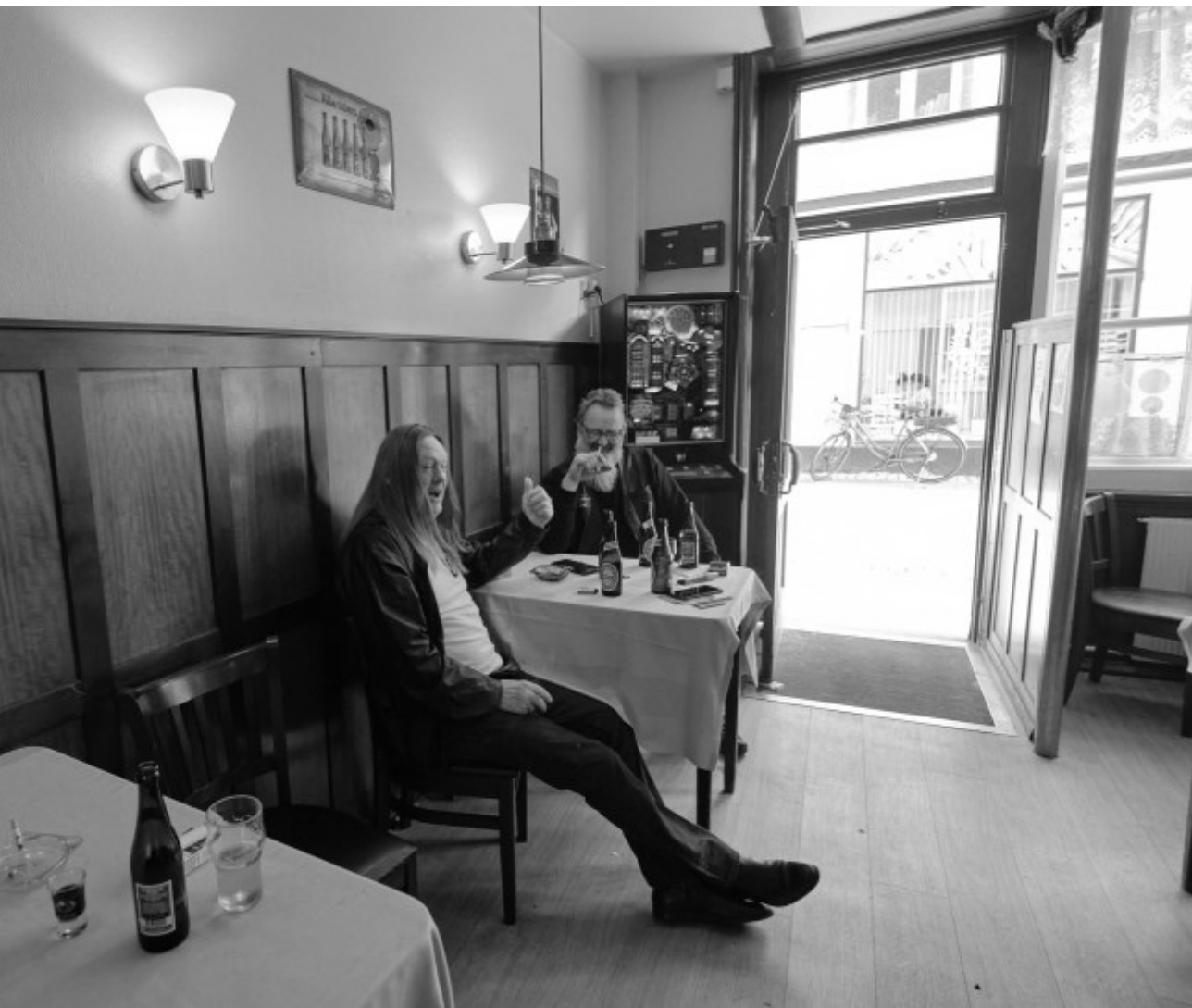
Stamkunder og personale på Café Valdemar, Helsingør Kl. 16.04