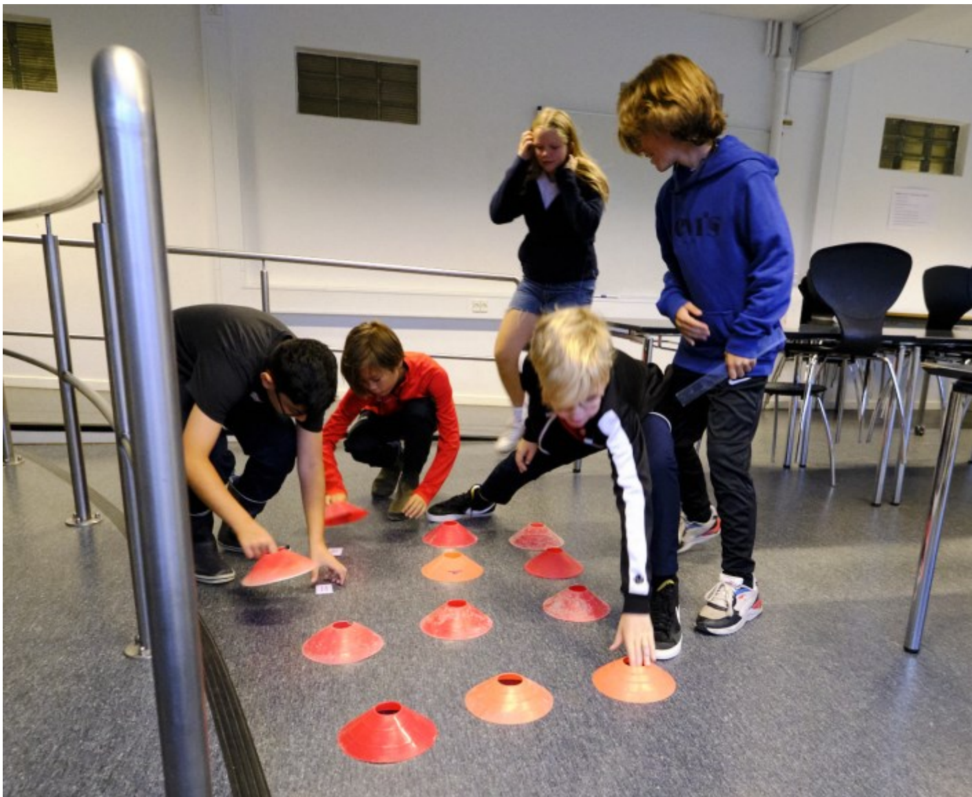
5B på Mørdrupskolen har matematik i bevægelse, Espergærde, Kl. 08.18