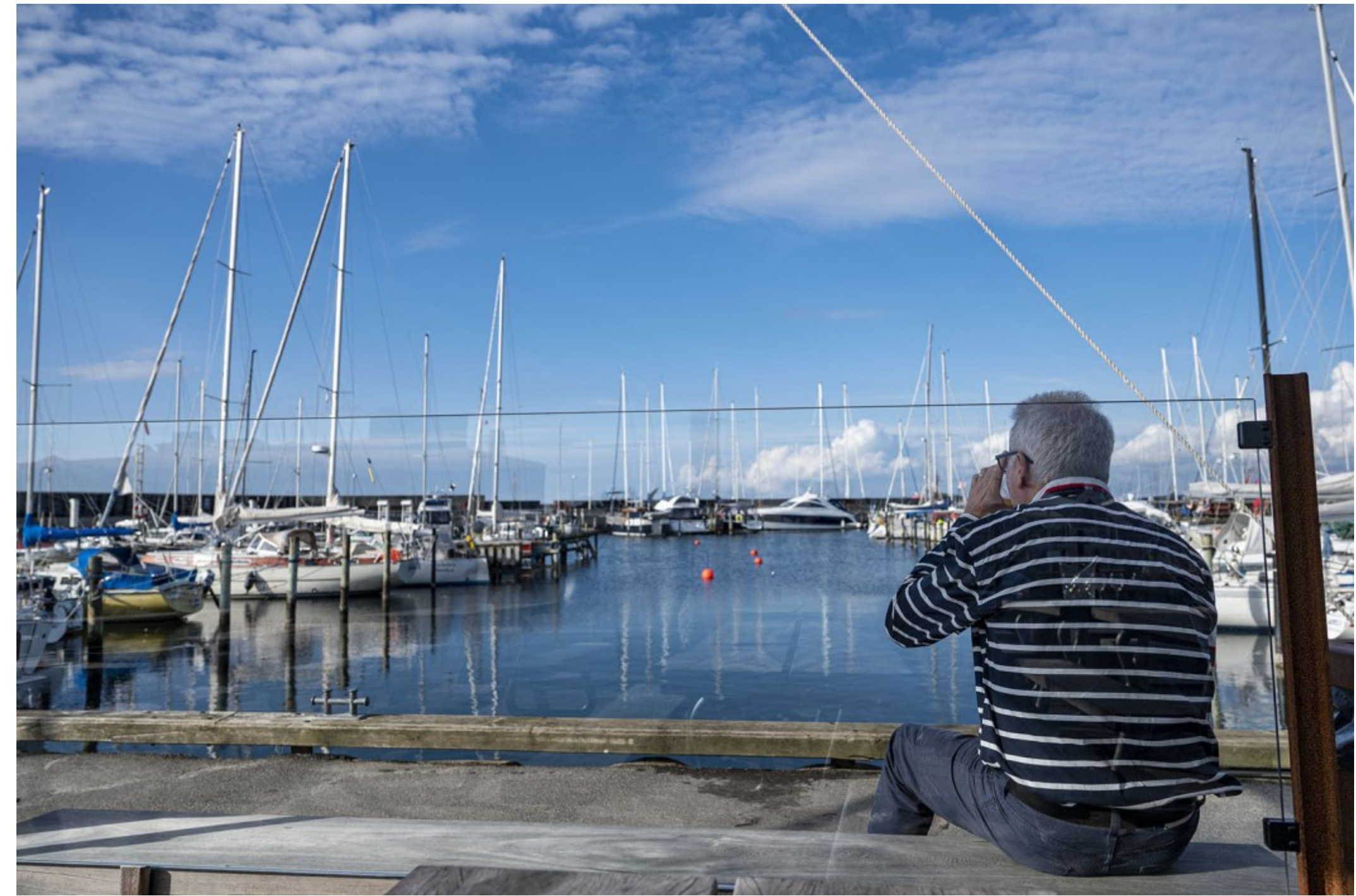
En fyraftensøl, Hornbæk Havn, Kl. 16.37