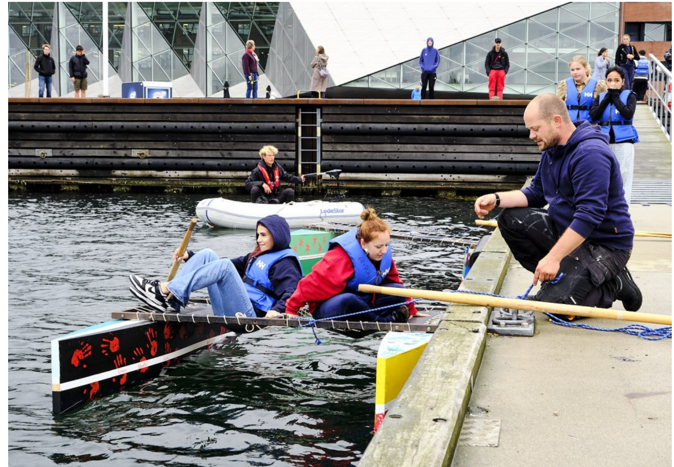
10. klasseskolen havde Håndværk på Havnen, hvor de denne dag skulle sætte deres hjemmebyggede både i vandet ved Helsingør, Kulturværftet. Kl. 11.46