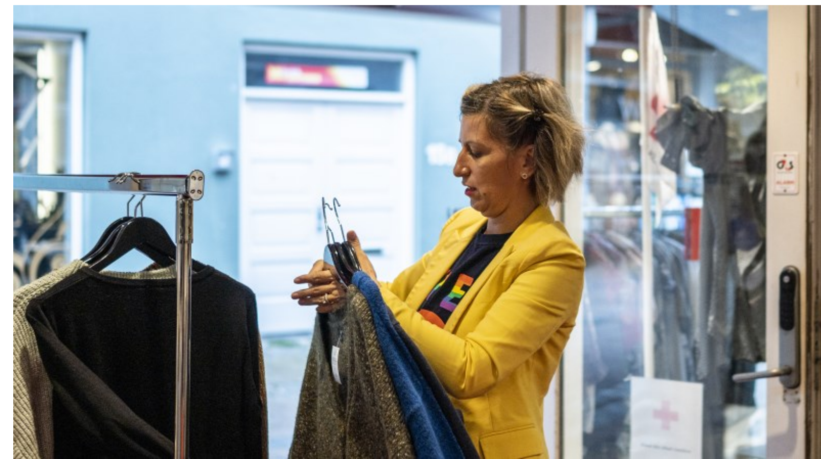
Genbrugstøj placeres på stativ i genbrugsbutikken (Røde Kors), Helsingør, Kl. 12.22.