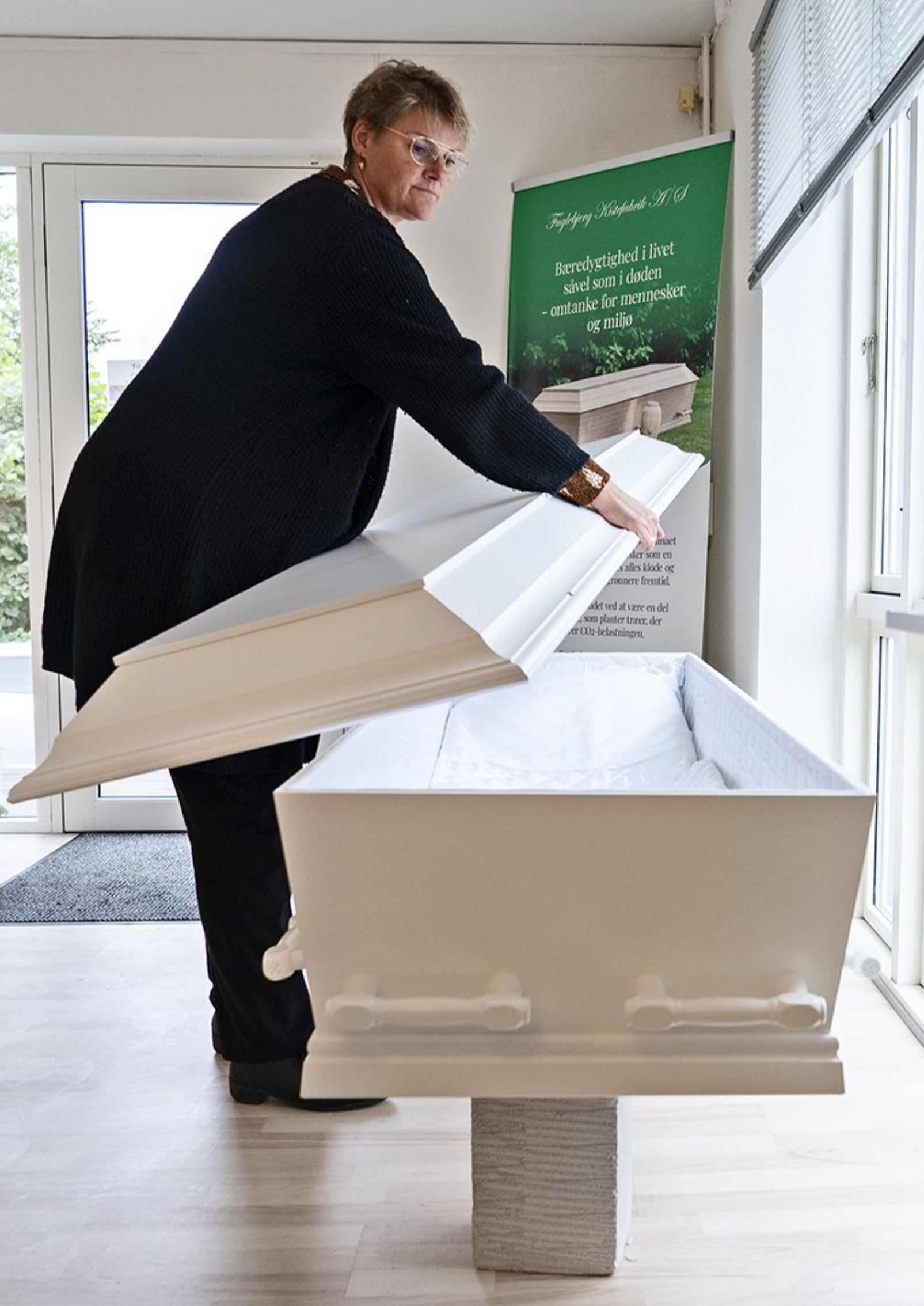
Låg på. Begravelse Danmark, Helsingør Kl. 11.45