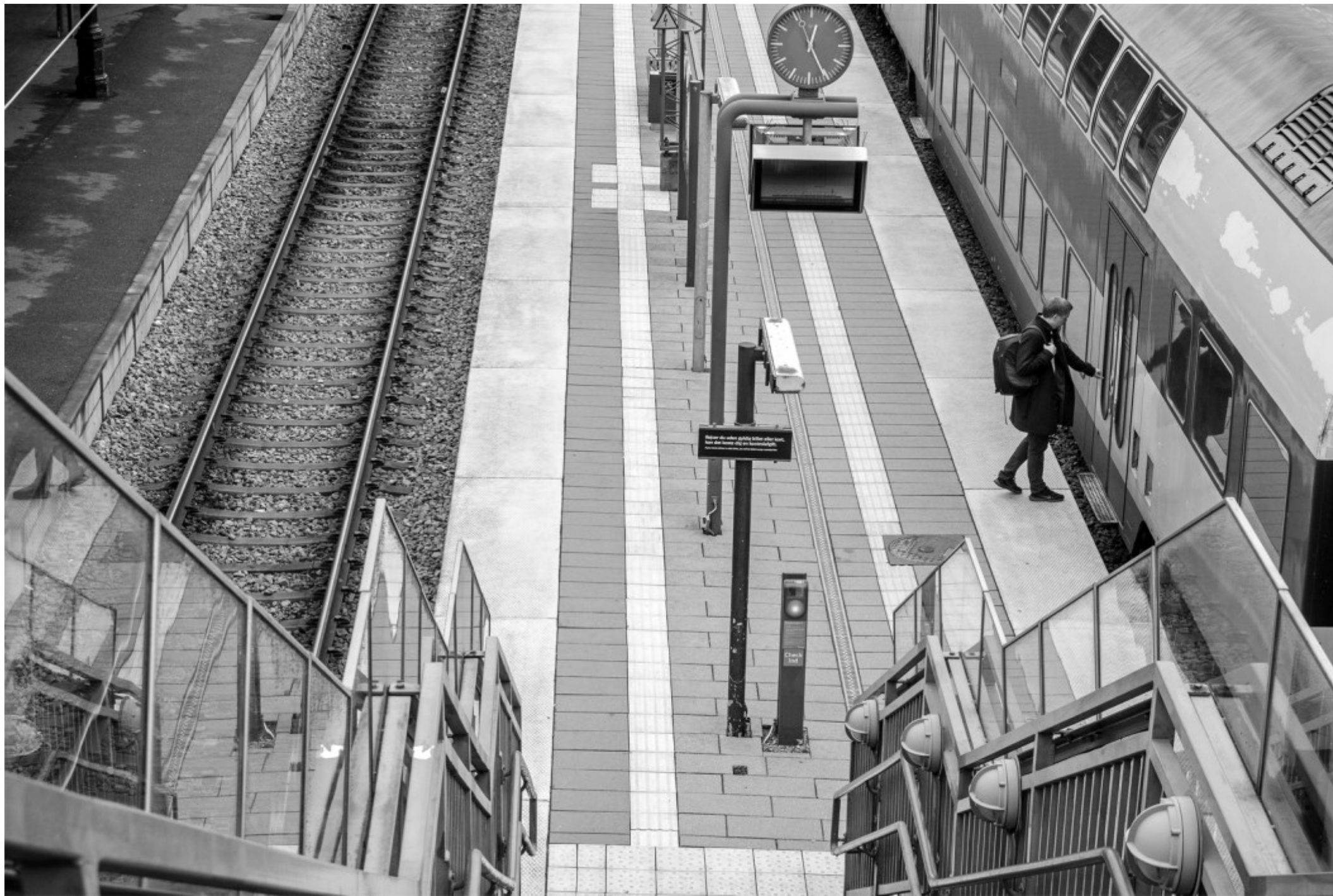
Kl. 12.25.