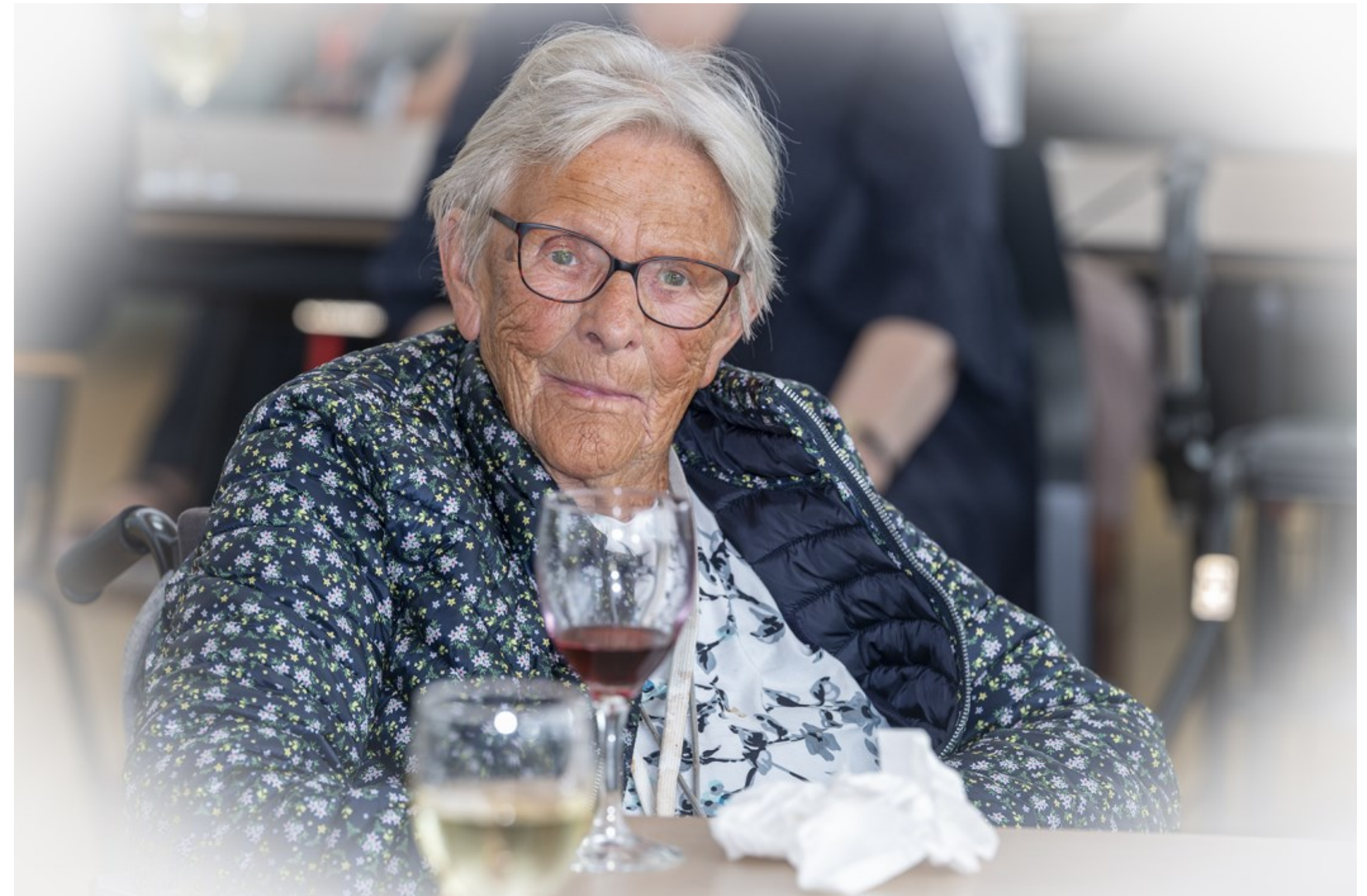
En hyggelig italiensk eftermiddag. Plejhjem Hornbækhave, Hornbæk Kl. 14.07