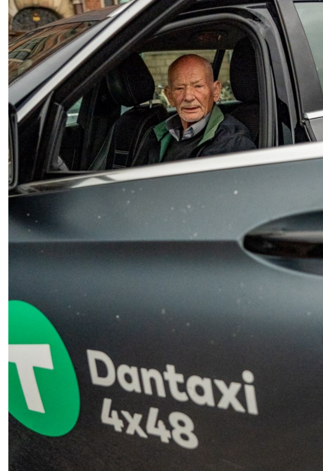
Helsingør's ældste taxachauffør, Kl. 11.57.