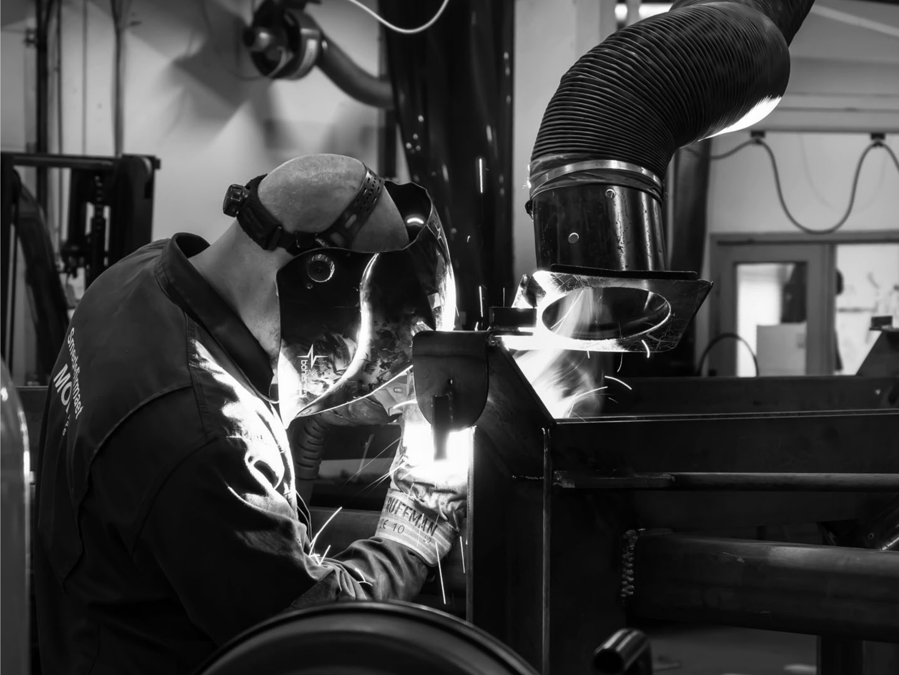
MOEL smedie, Kvistgård KL. 08.37