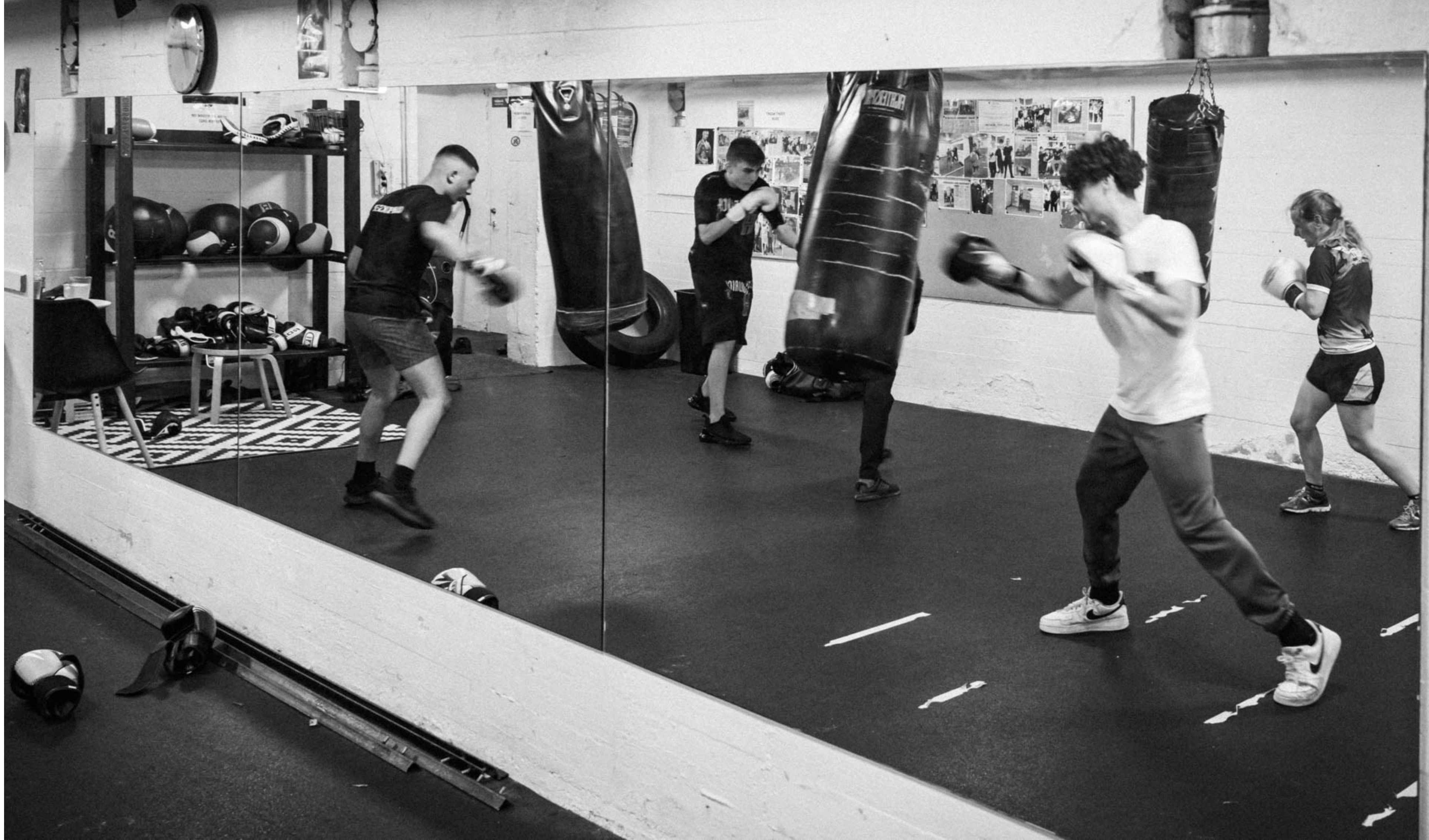
Boksetræning, Værestedet Tetriz, Helsingør Kl. 16.52, Foto: Svend Erik Ladefoged