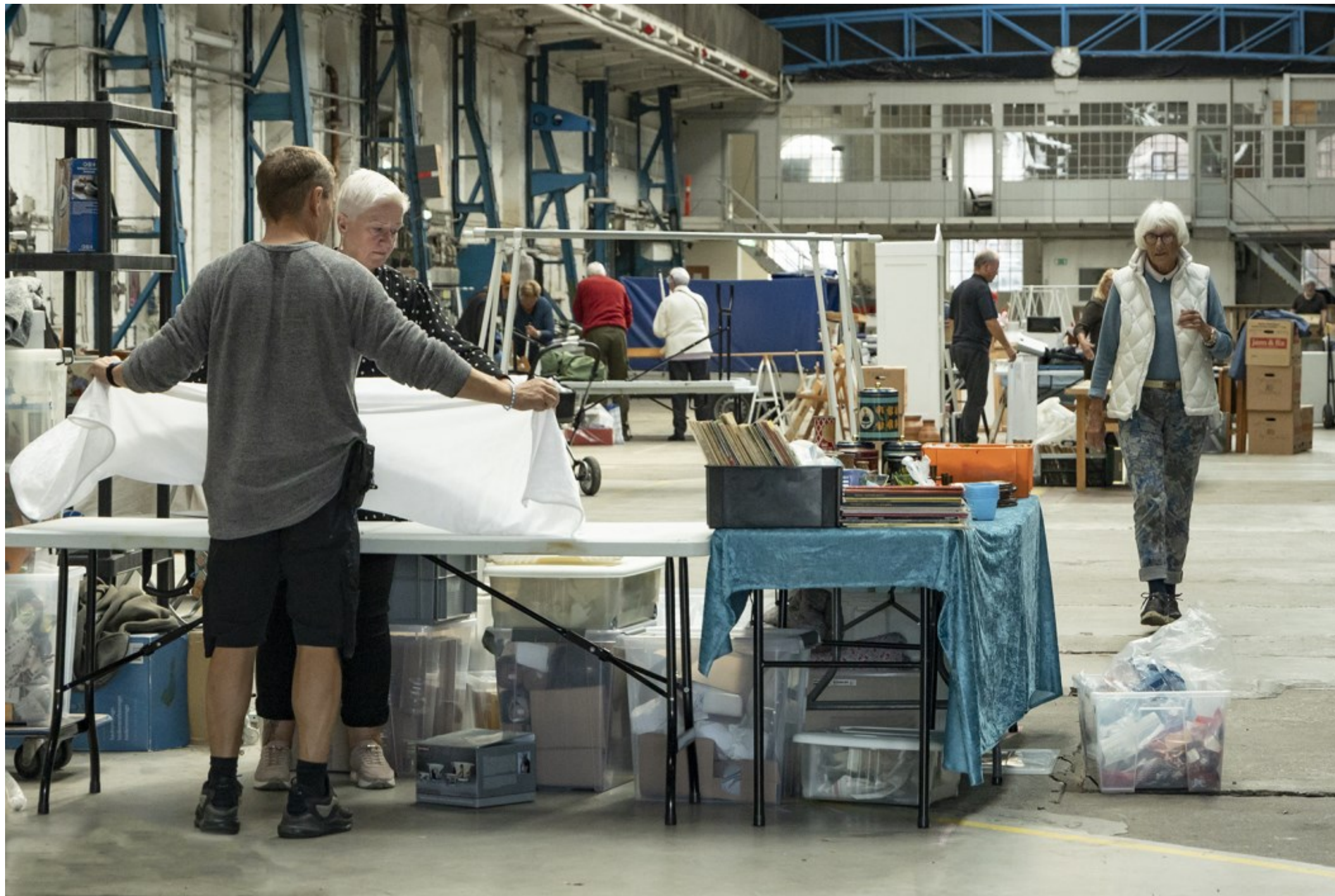
Kl. 16.15.

Forberedelse til Helsingør Loppetorv Værftet den 10.9.2022