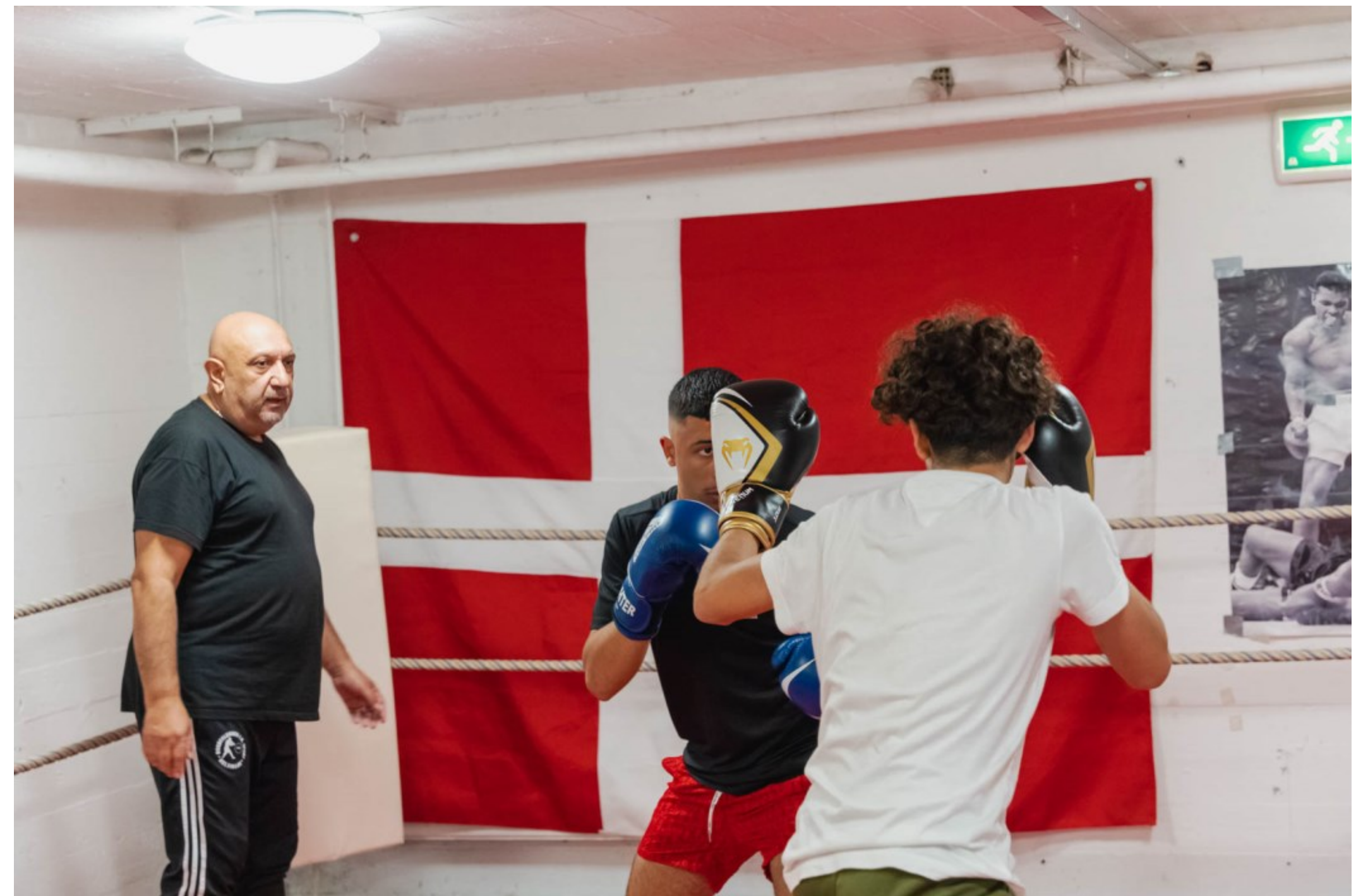
Boksetræning, Værestedet Tetriz, Helsingør, Kl. 16.47 + 16.39