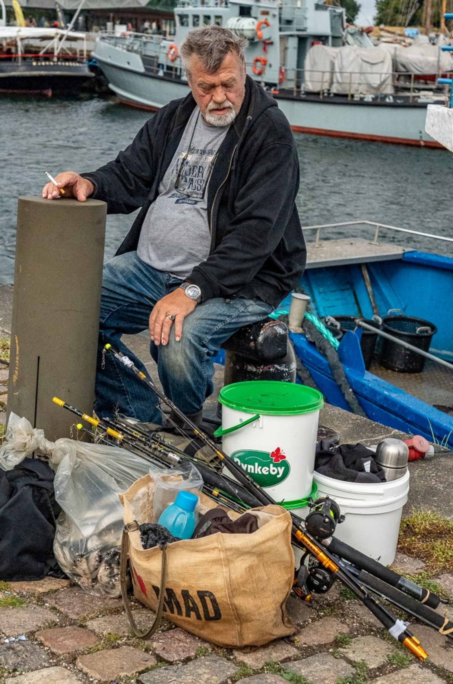
En velfortjent smøg efter en god dag på sundet