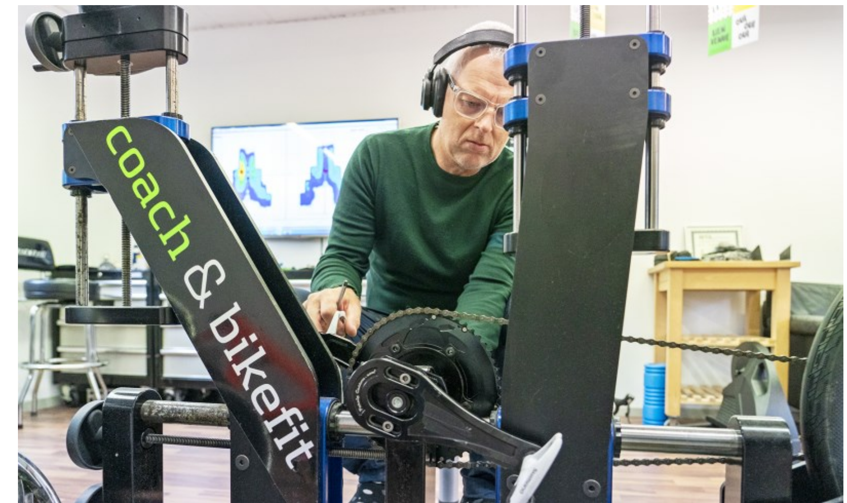
Højeste præcision, coach & bikefit, Helsingør Kl. 12.02.