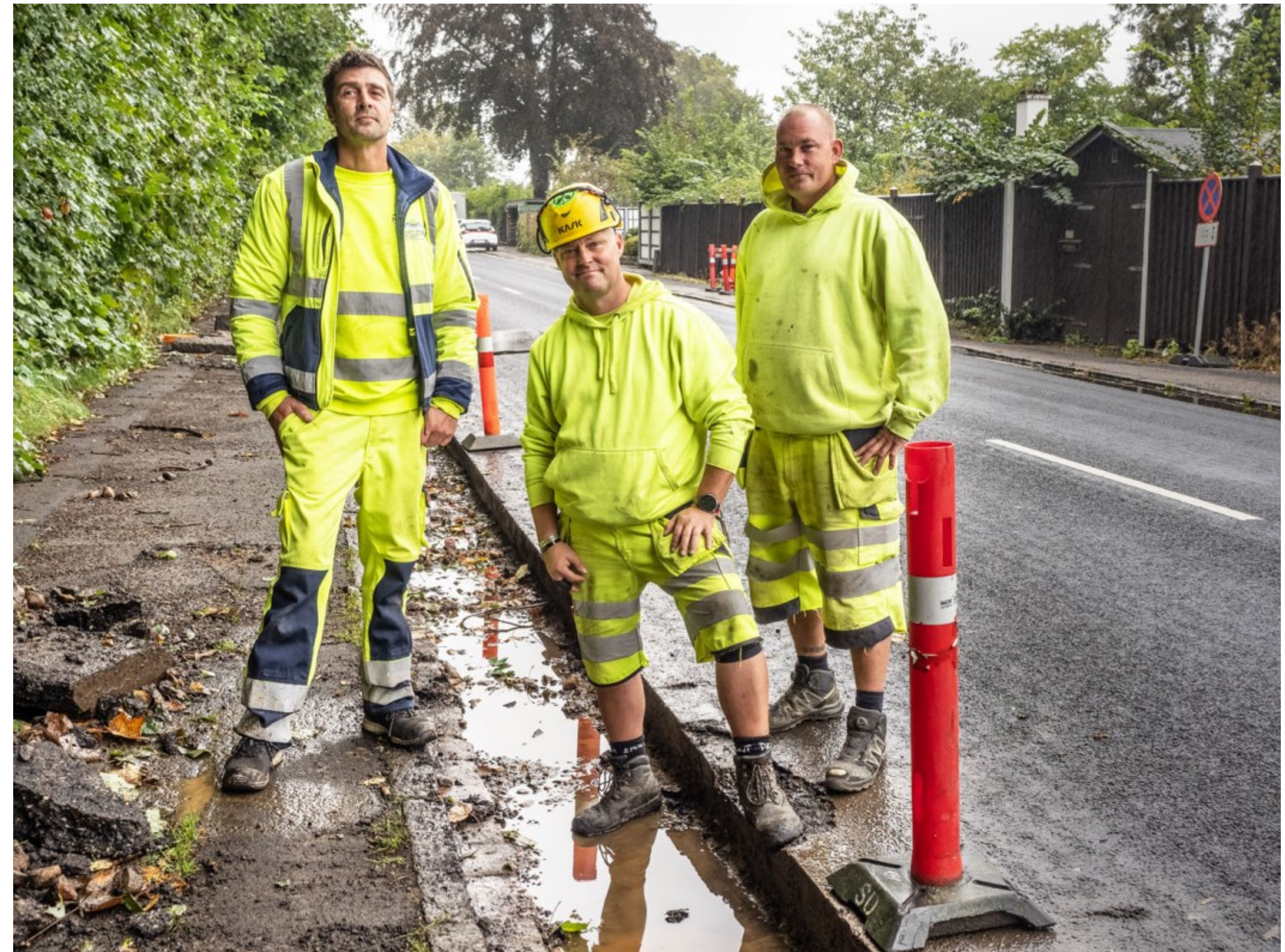
Kl. 09.48.