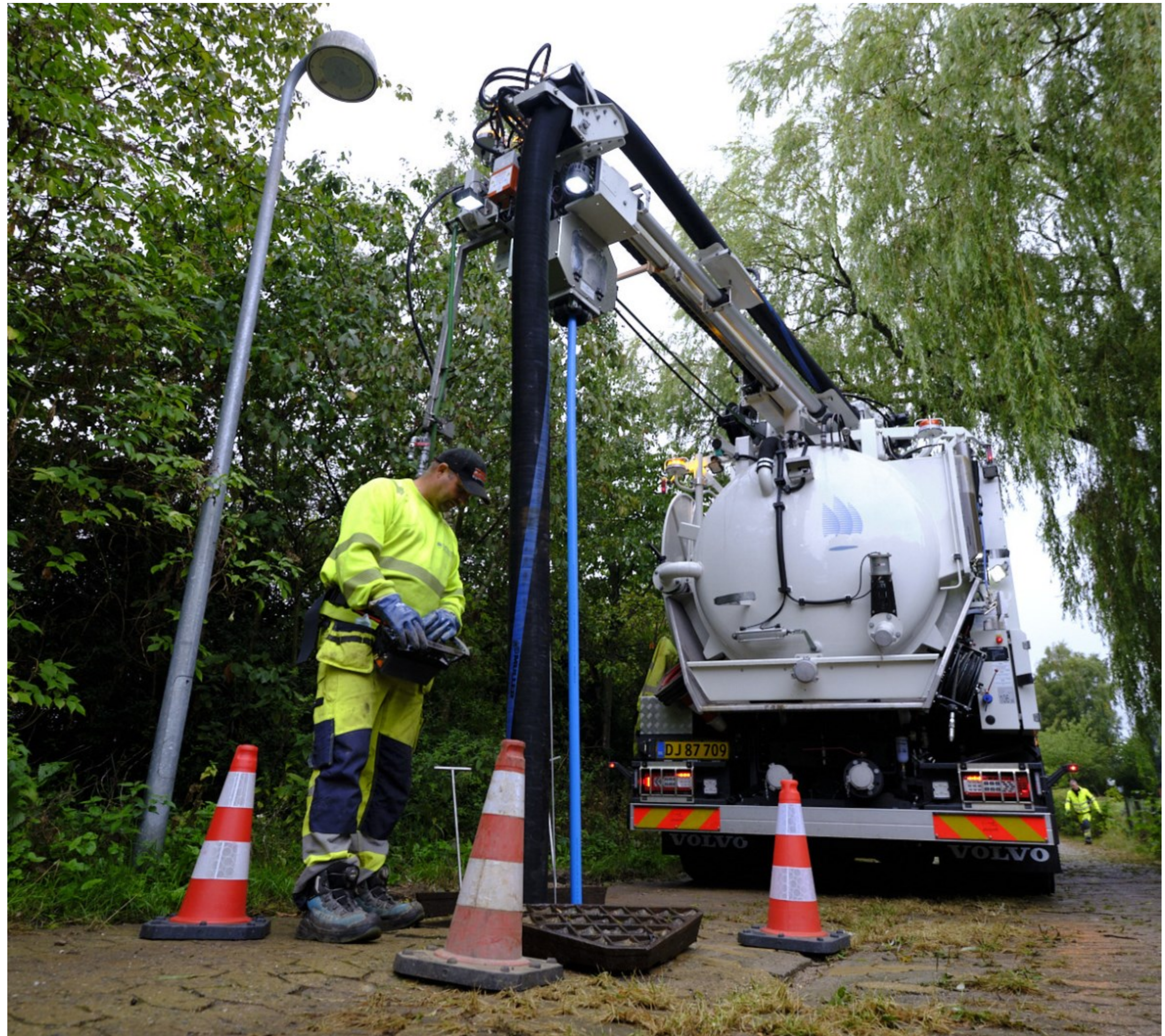
Kl. 11.00