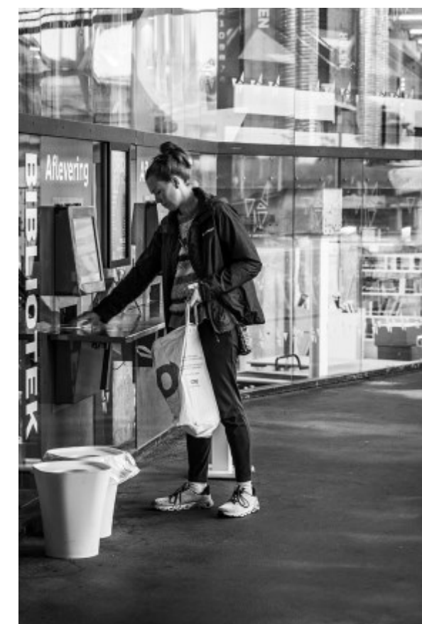
Bøgerne afleveres Kl. 08.15.