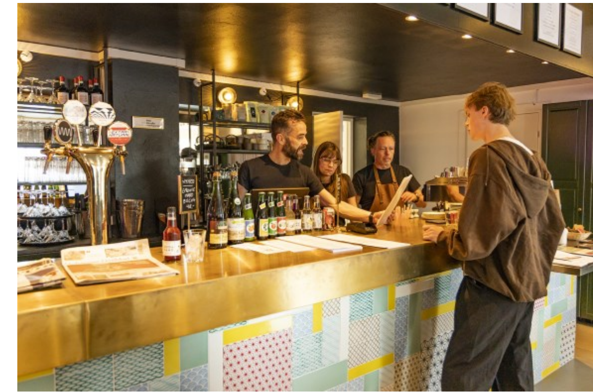
Besøg i Album Bar i Hovedvagsstræde, Helsingør Kl. 16.58