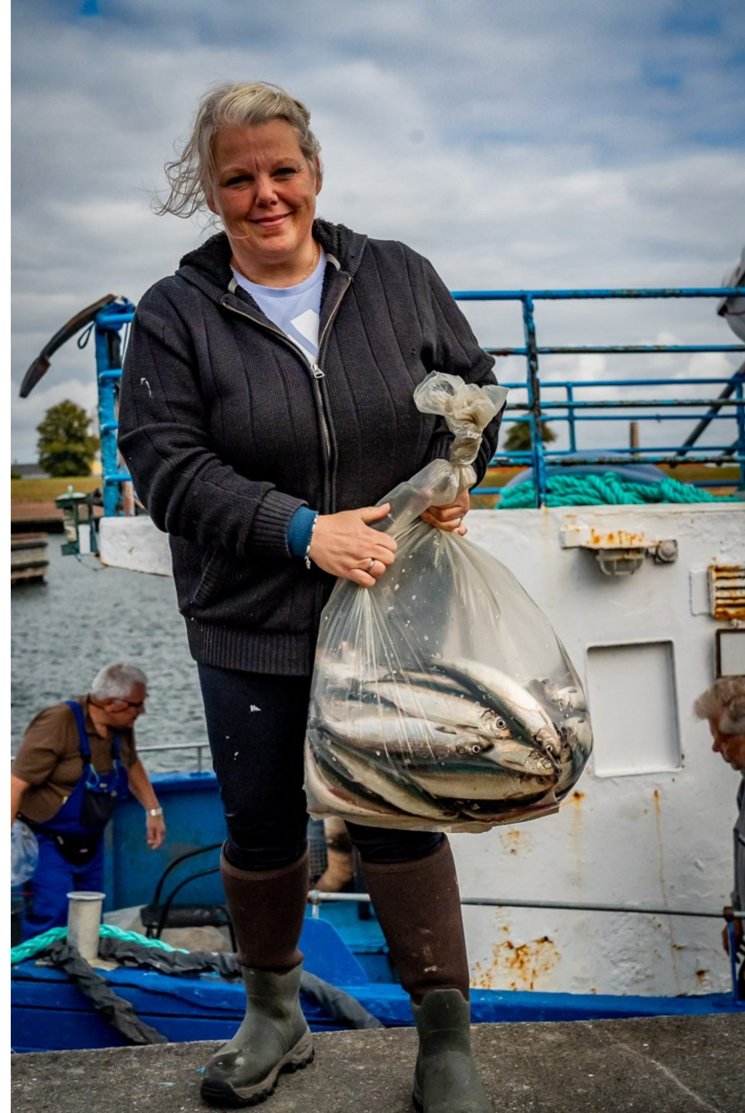
Silden er landet - en god dag på sundet