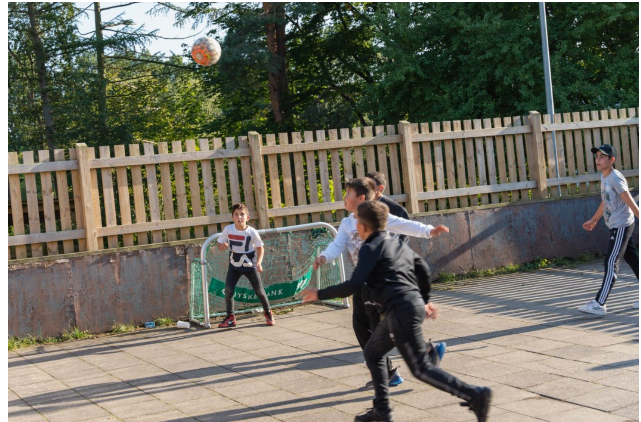
På Værestedet Tetriz for unge 12-17 årige dyrkes der blandt andet boksning for både piger og drenge, fodbold og andre sport og spil aktiviteter, Værestedet Tetriz, Helsingør, Kl. 16.58, Foto: Svend Erik Ladefoged