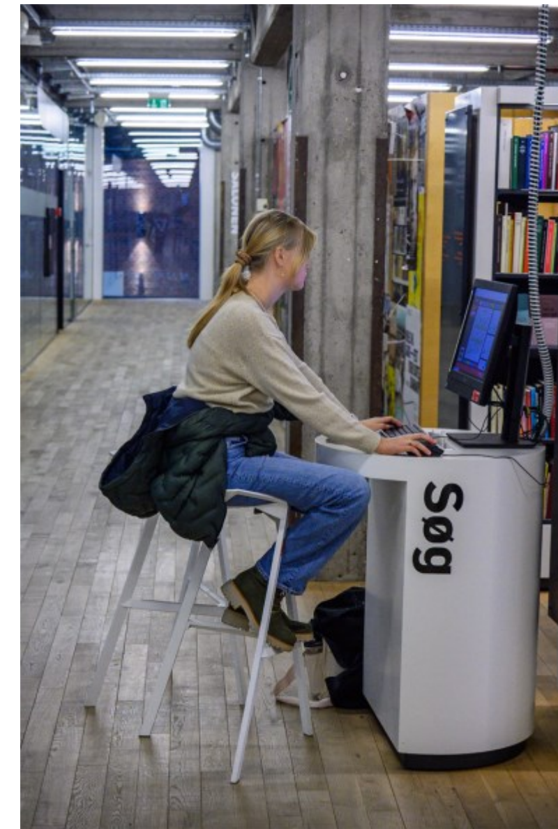
En skoleelev laver lektier Kl. 08.39.