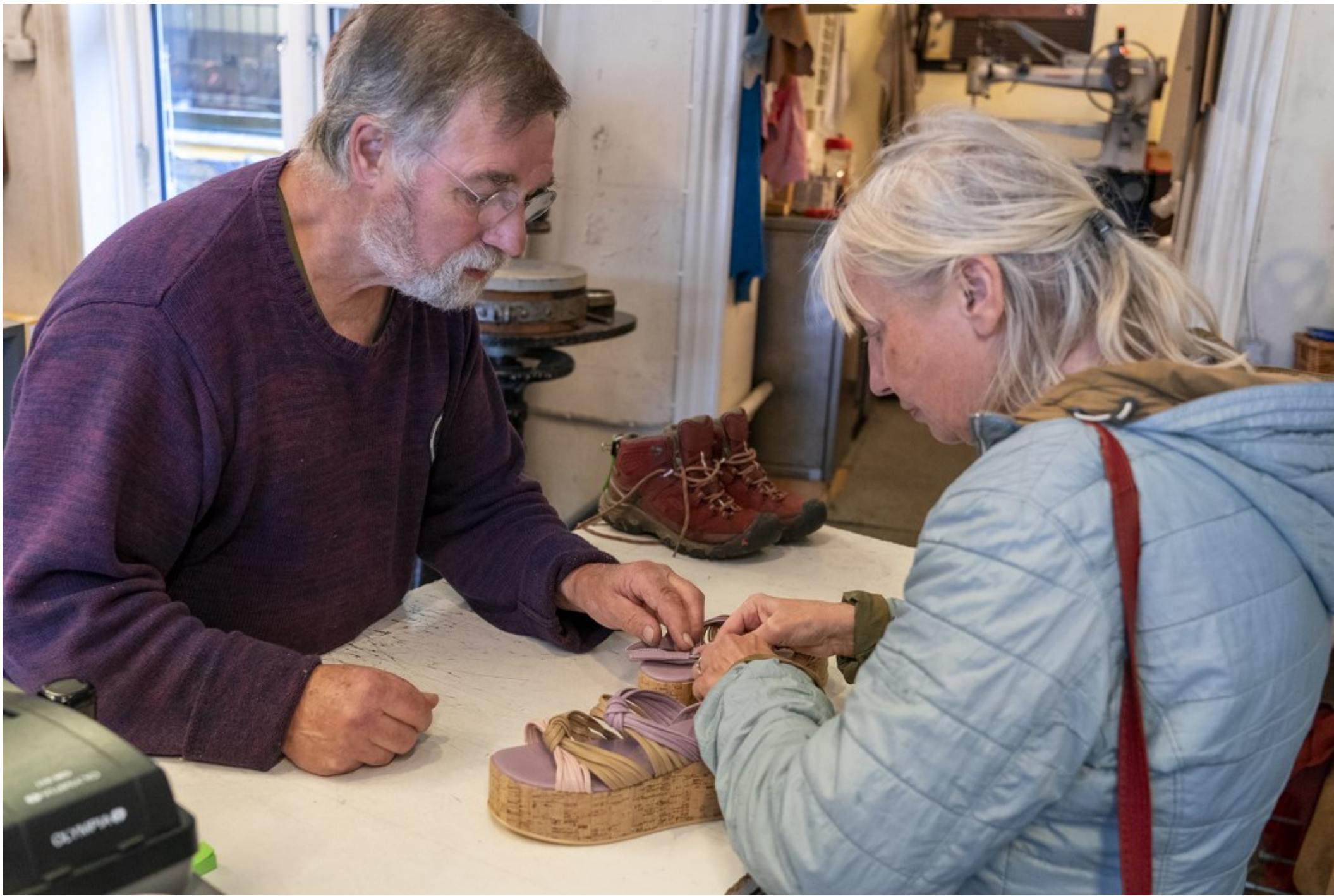
Der skal laves et hul mere i remmen, Skomagerværksted, Helsingør, Kl. 13.31