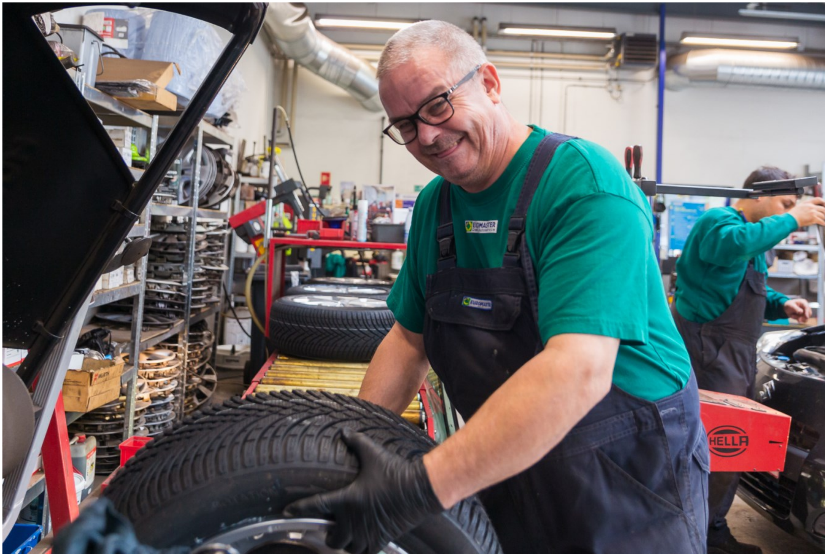
Dækskift, Euromaster, Helsingør Kl. 11.10 + 11.17.