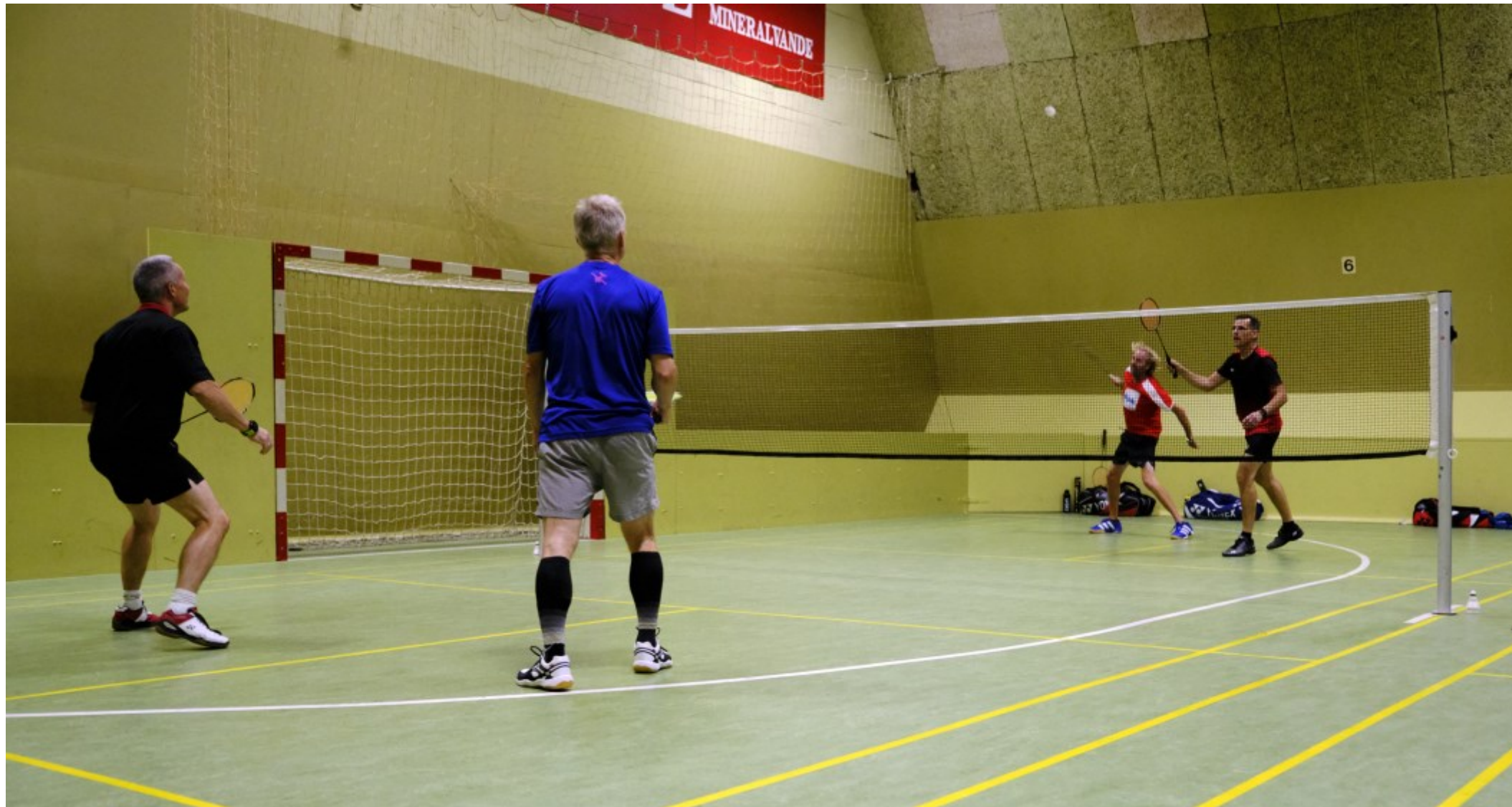
Badminton i Badmintonhallen på Ndr. Strandvej, Helsingør, Kl. 15.31, Foto: Lars Andreassen