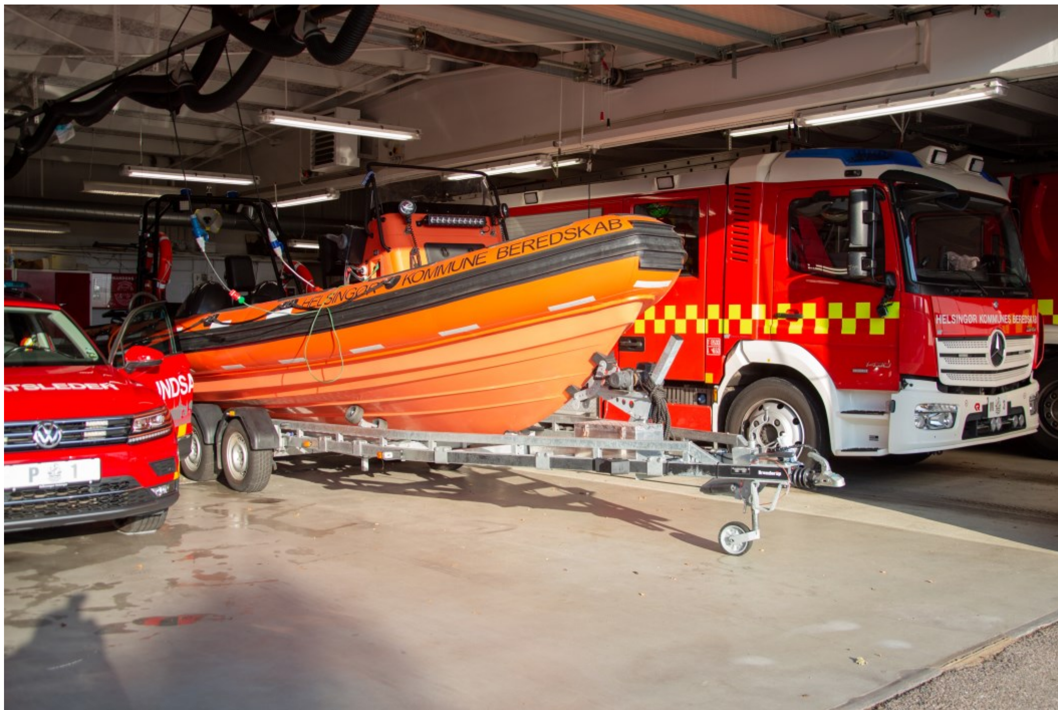
Før udrykning. Kl. 17.49