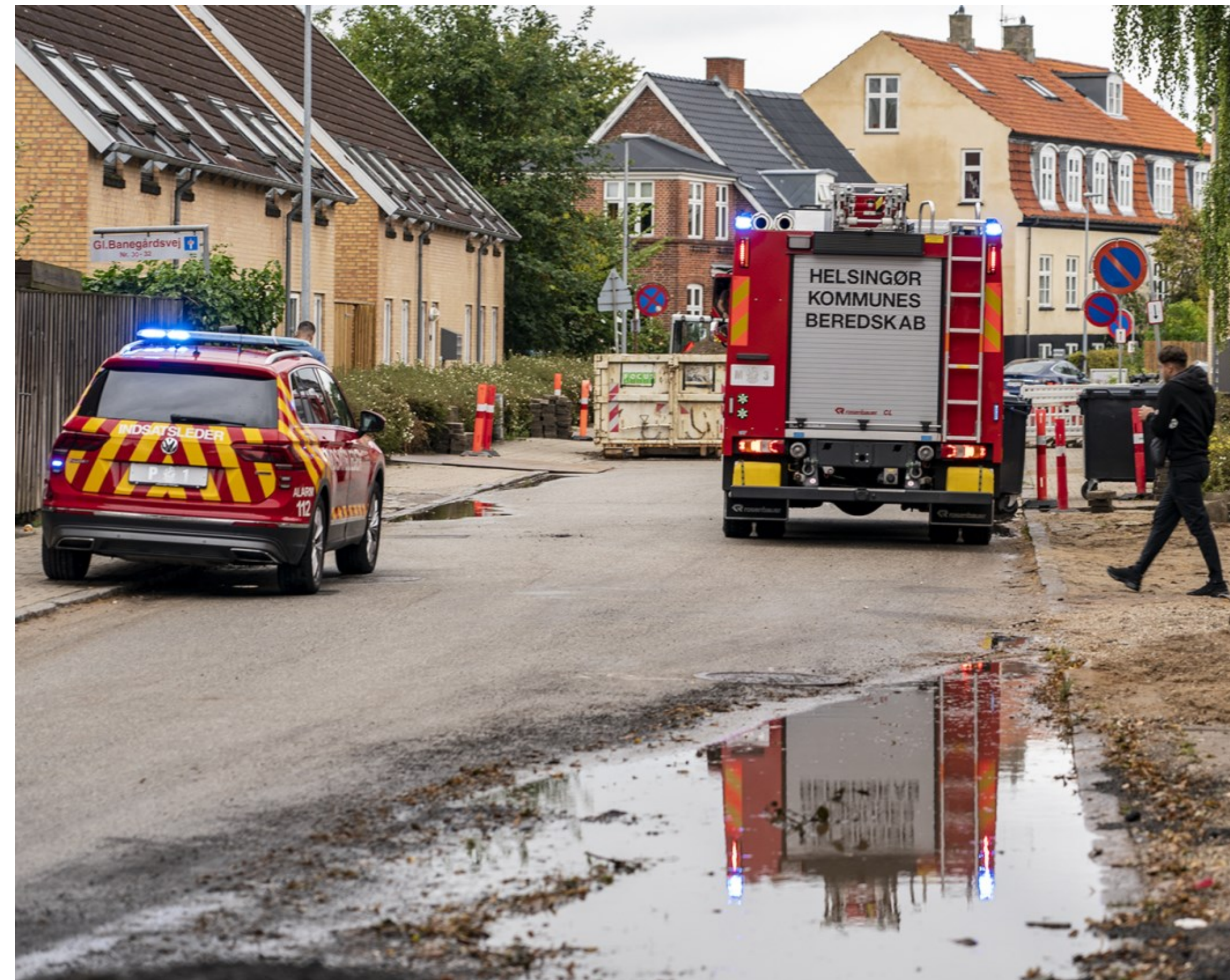
Efter indsatsen, Kl. 12.23, Foto: Martin Schaffer