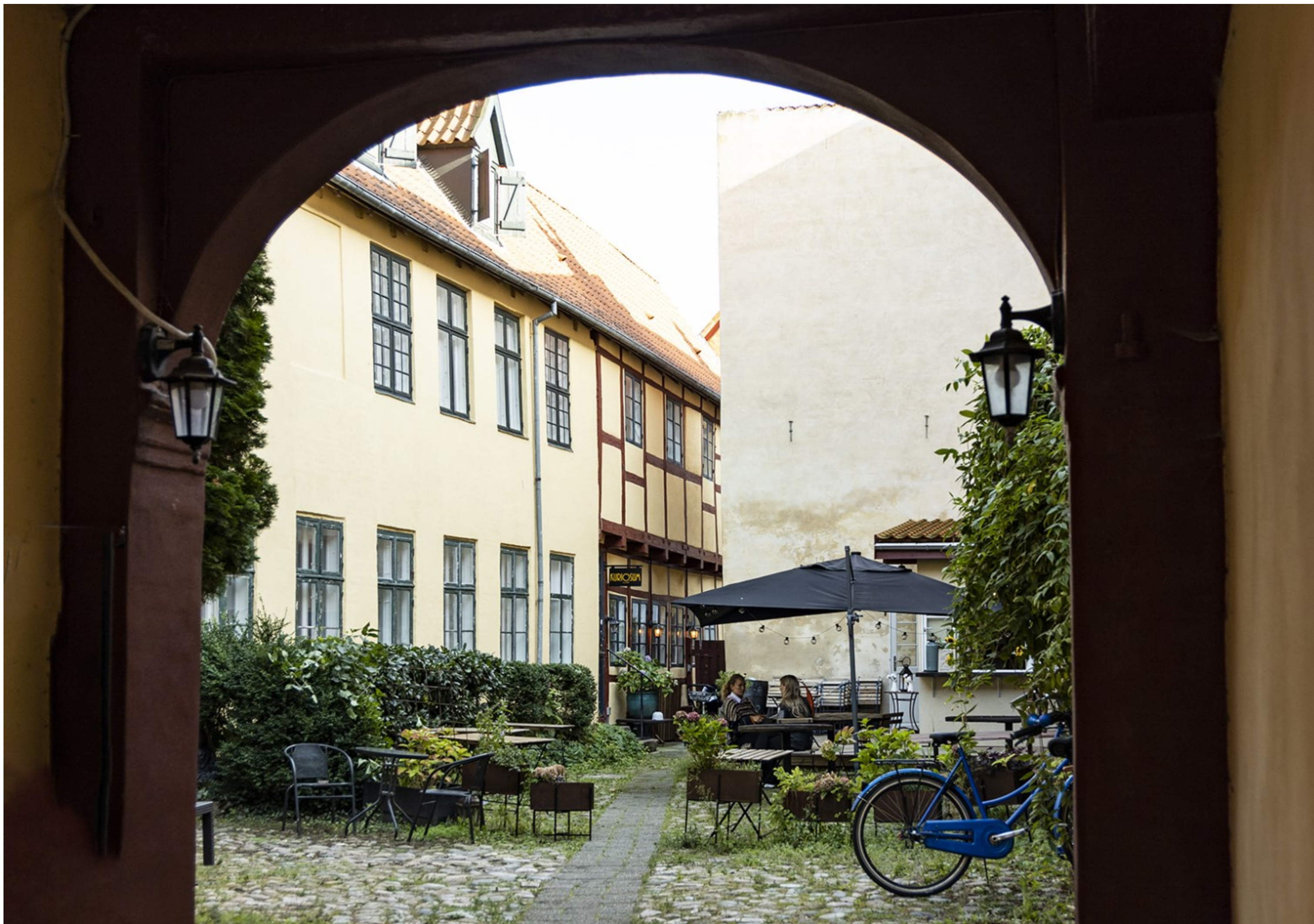
Et kig ind i gården til Kuriosum, Stengade 48 F, Helsingør, Kl. 16.47, Foto: Hanne Jørgensen