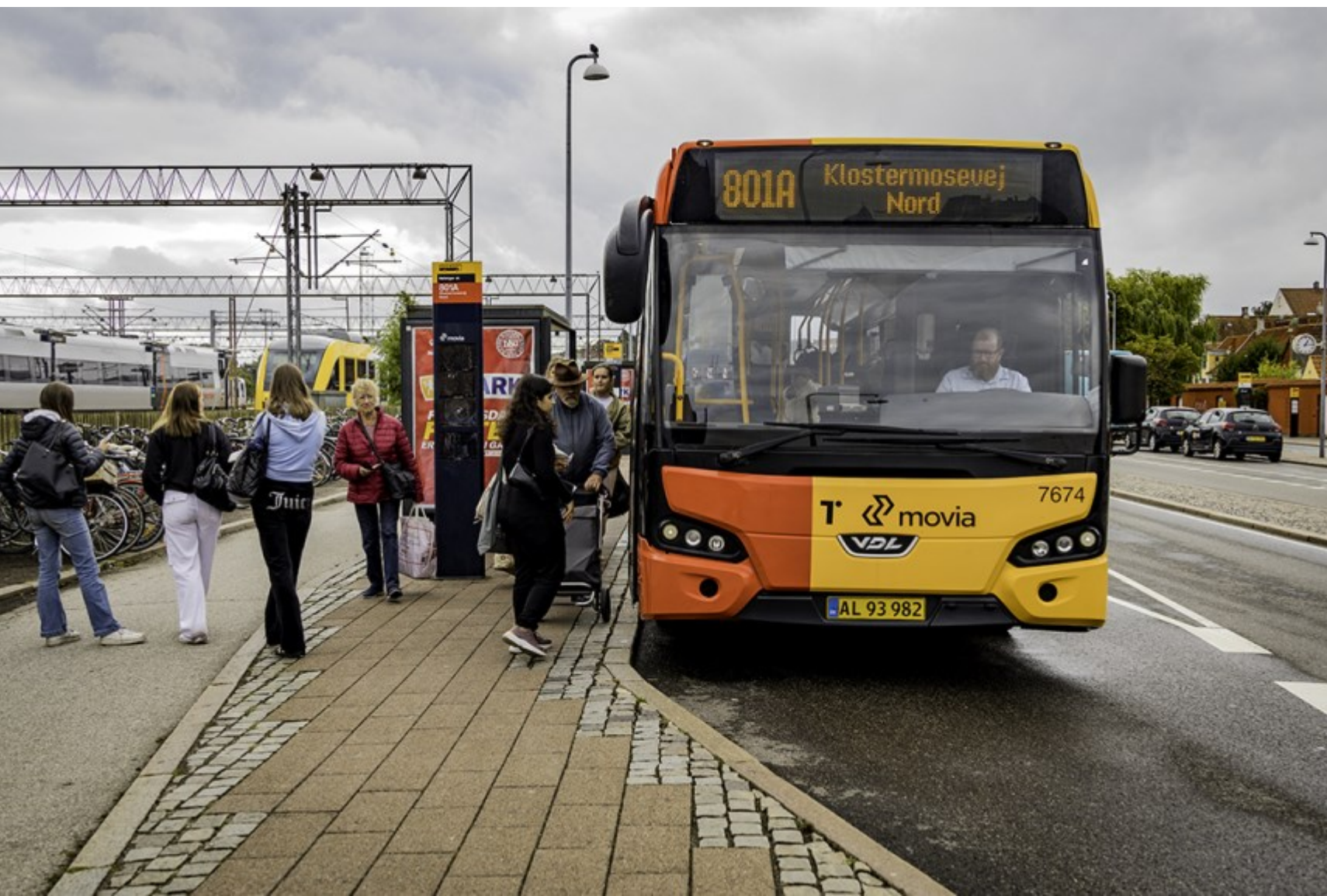
Helsingør Station, Kl. 12.23