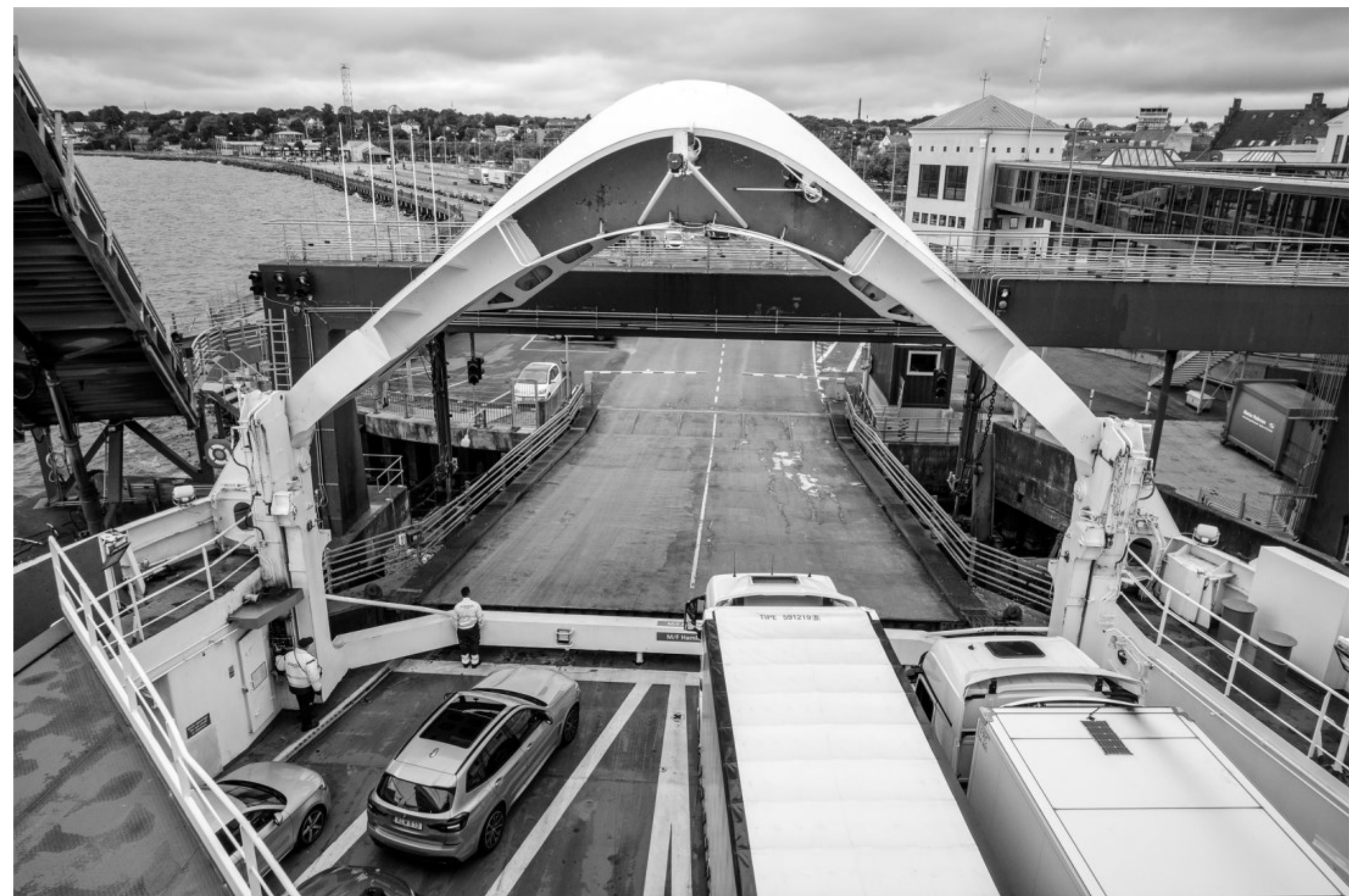
Kl. 11.55.