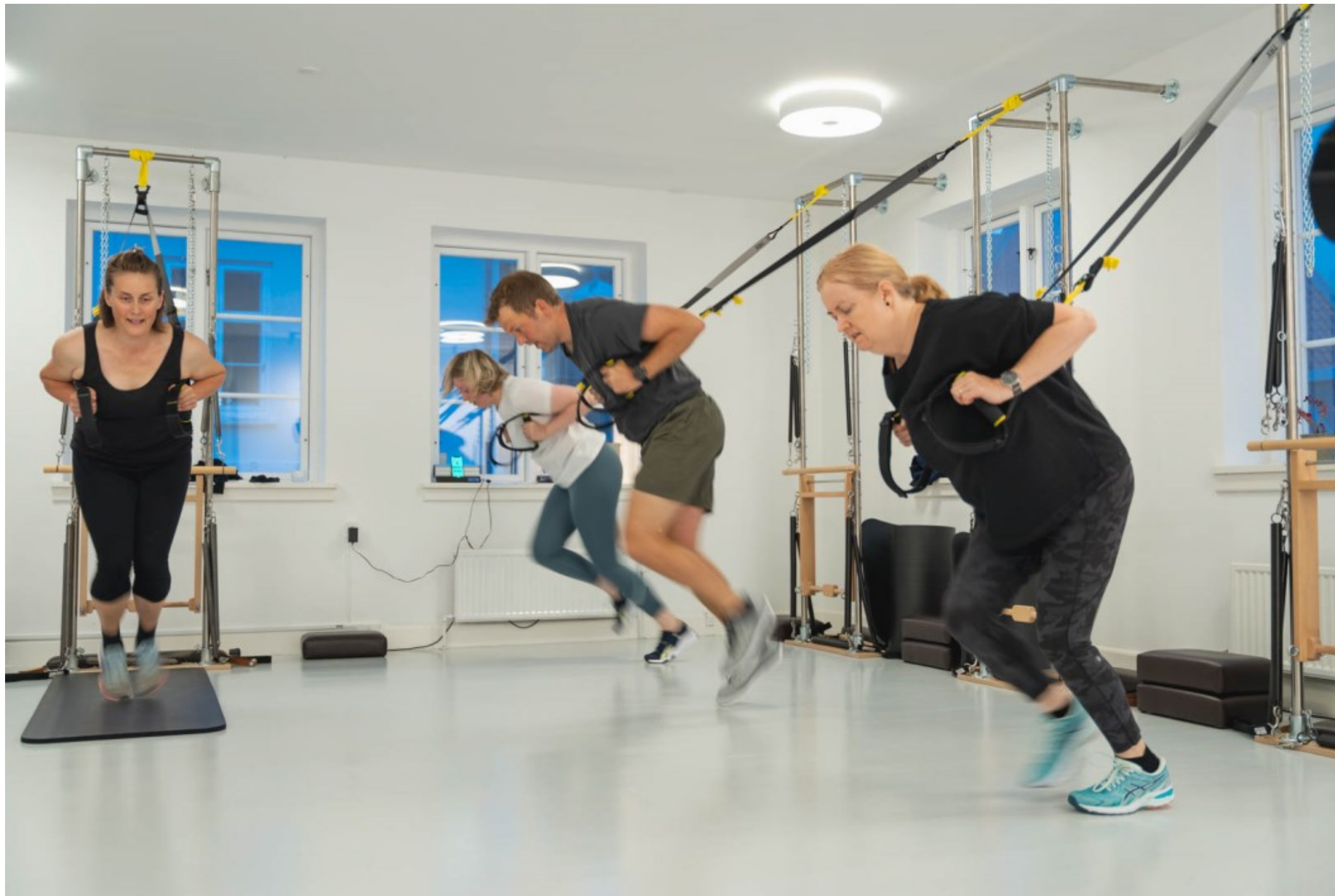
Morgentræning før dagens dont. Der trænes balanceøvelser; der udstrækkes og styrketrænes - for smidigere muskler, bedre kropskontrol og kropsbalance, Pilateshuset, Helsingør, Kl. 07.00, Fotos: Svend Erik Ladefoged