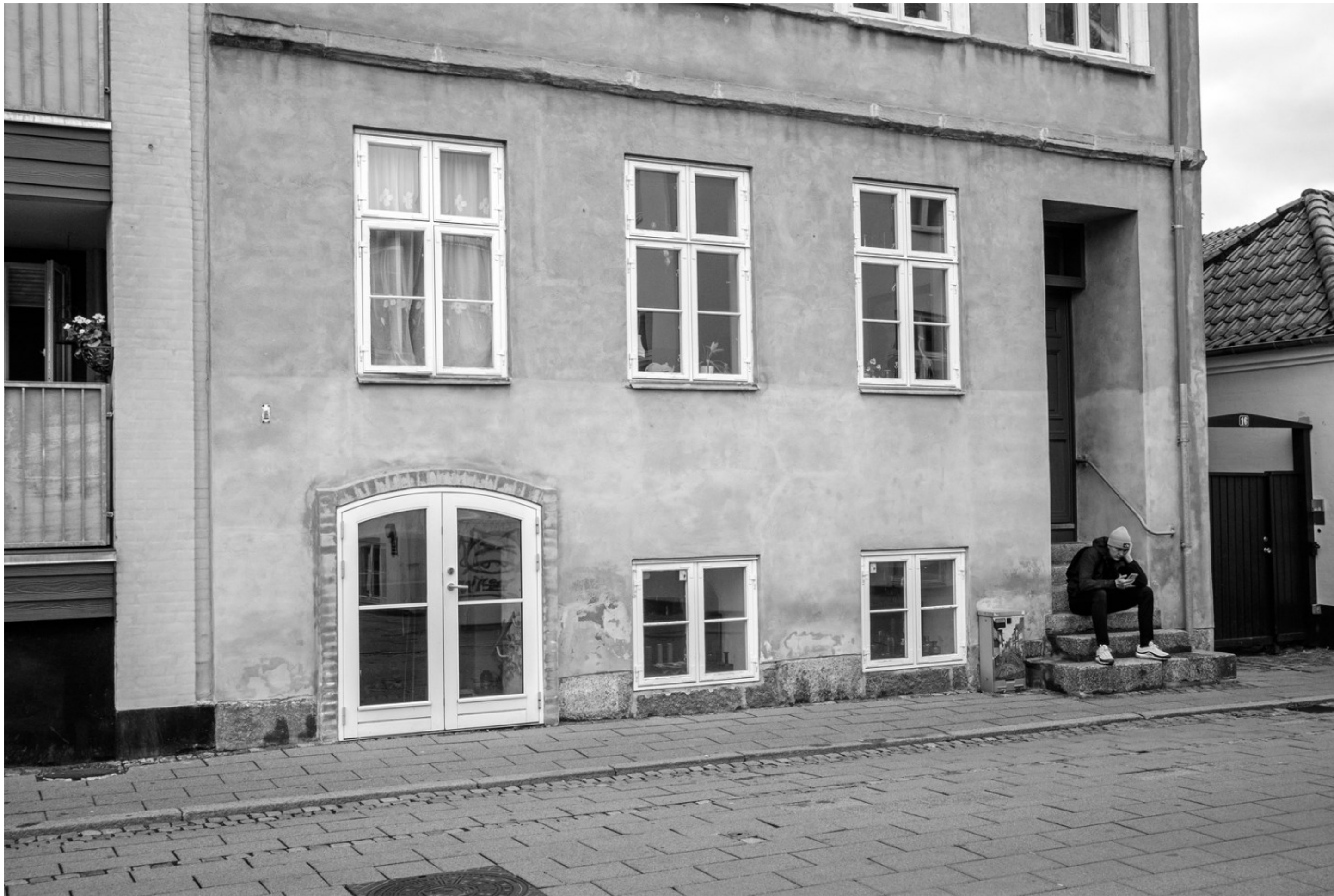
Fiolgade, Helsingør, Kl. 13.16, Foto: Kasper Zeij

Blicherparken har affaldssortering så det er med at vælge den rigtige beholder. Restaffaldet skal i den rette beholder.