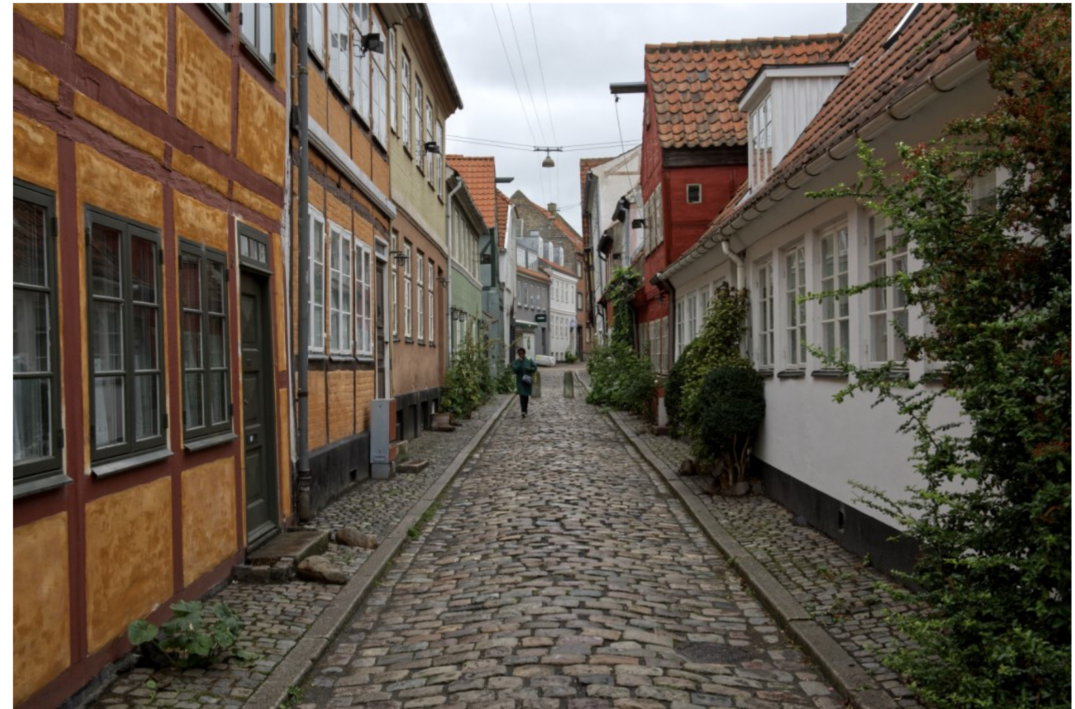
Gyldenstræde mod Stengade, Helsingør