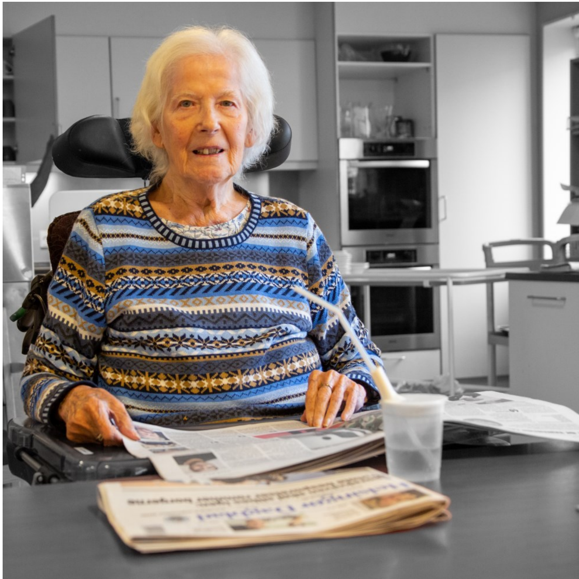
Avislæsning på Plejehjemmet Grønnehaven, Helsingør Kl. 10.40