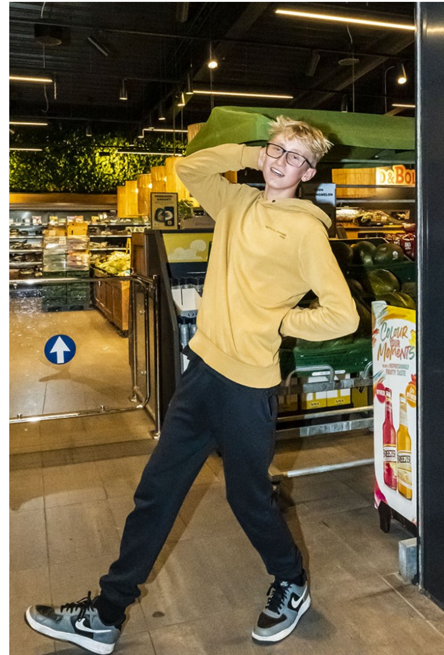
Netto lige før lukketid, Hornbæk Kl. 21.21