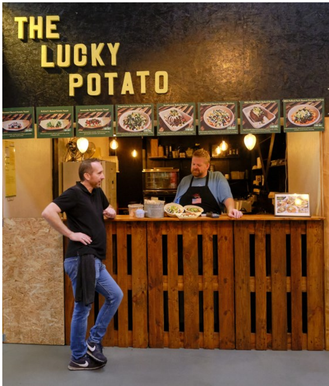
Kollegasnak Kl. 12.10.