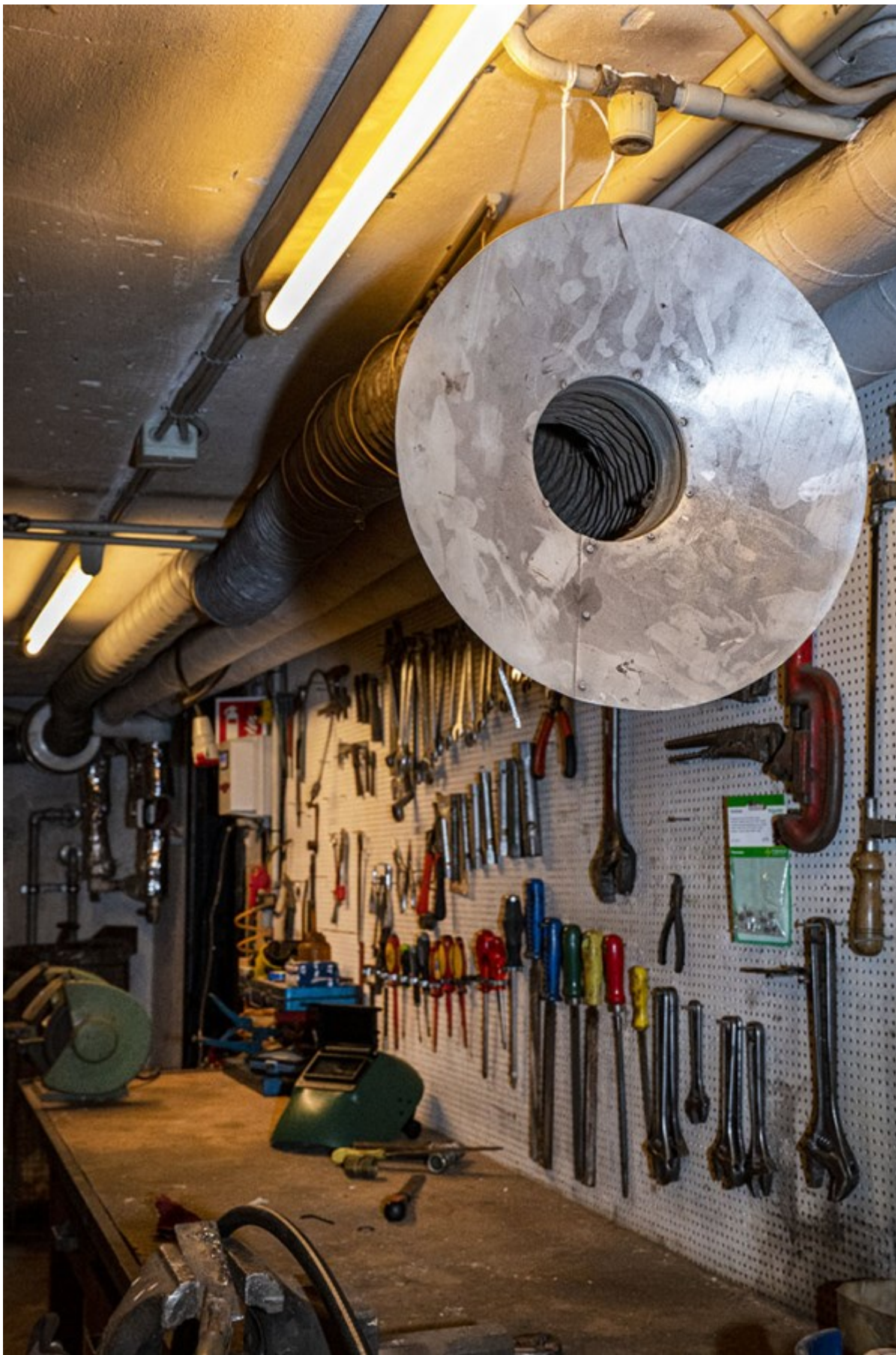
Hornbæk Forsynings værksted, Hornbæk, Kl. 10.56, Foto: Dani Håkansson