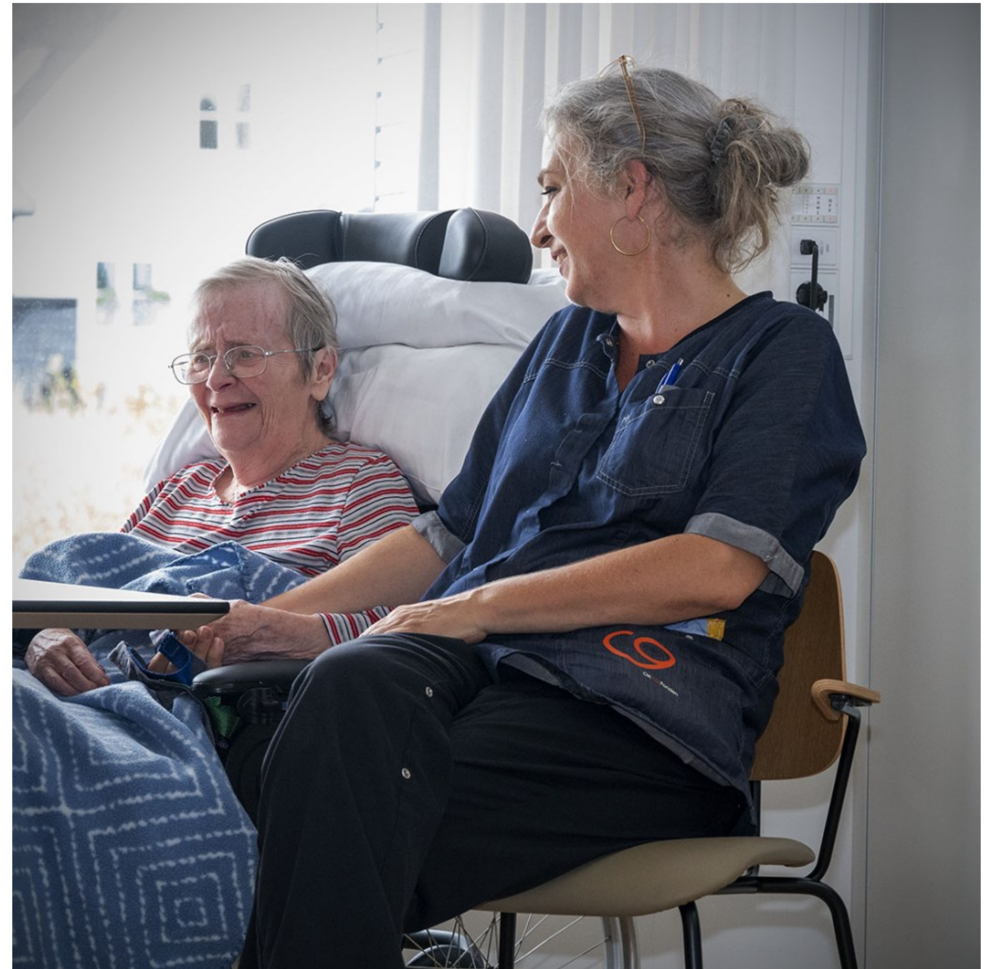
En hyggelig stund, Plejehjem Hornbækhave, Hornbæk Kl. 14.12