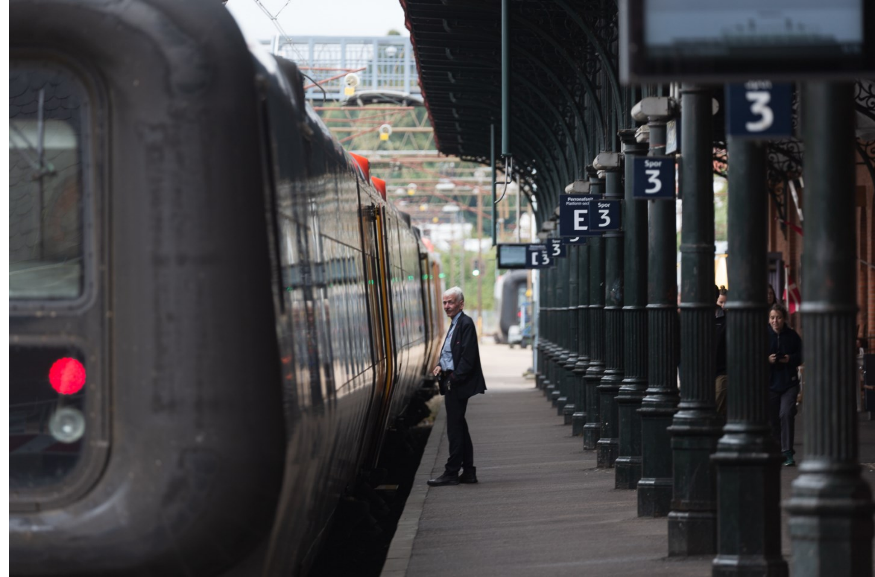
Kl. 12.27.