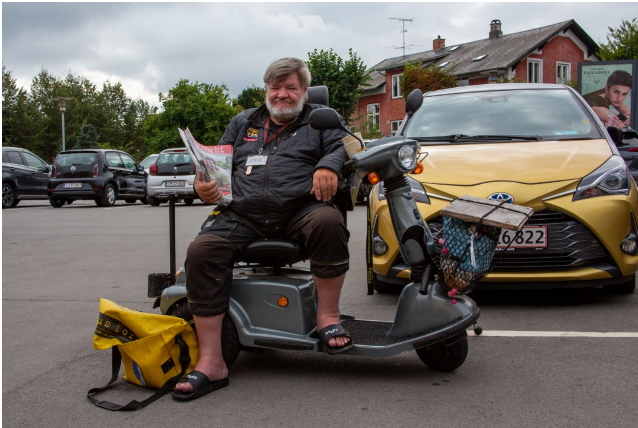
Hus Forbi sælger, Helsingør Kl. 14.38