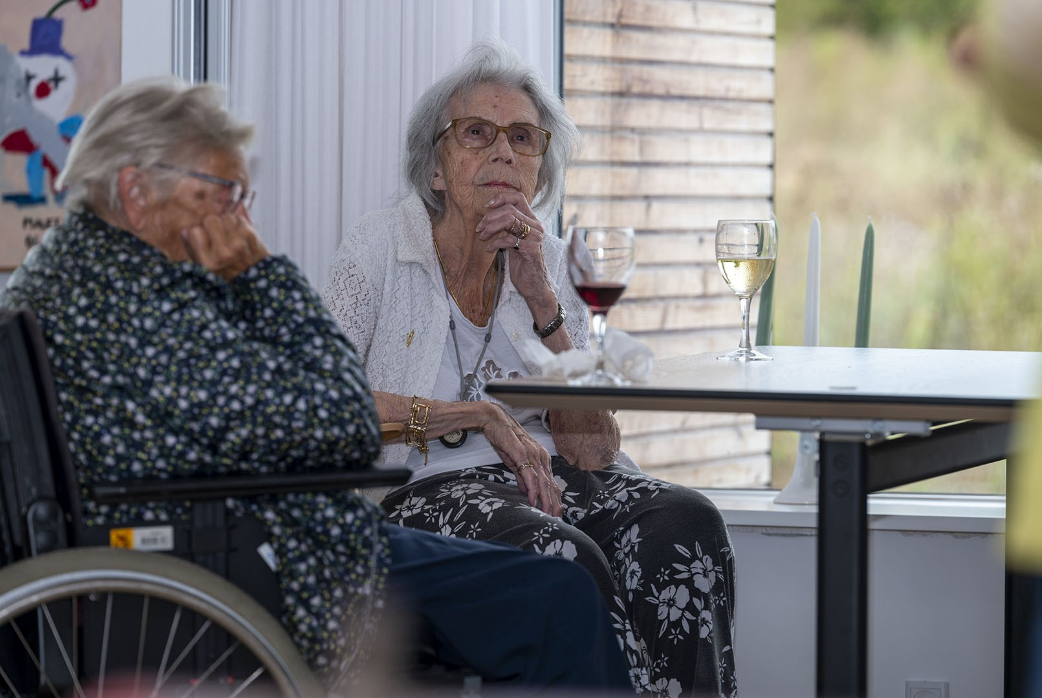
Italiensk musikeftermiddag, Plejhjem Hornbækhave, Hornbæk Kl. 14.01, Foto: Dani Håkansson