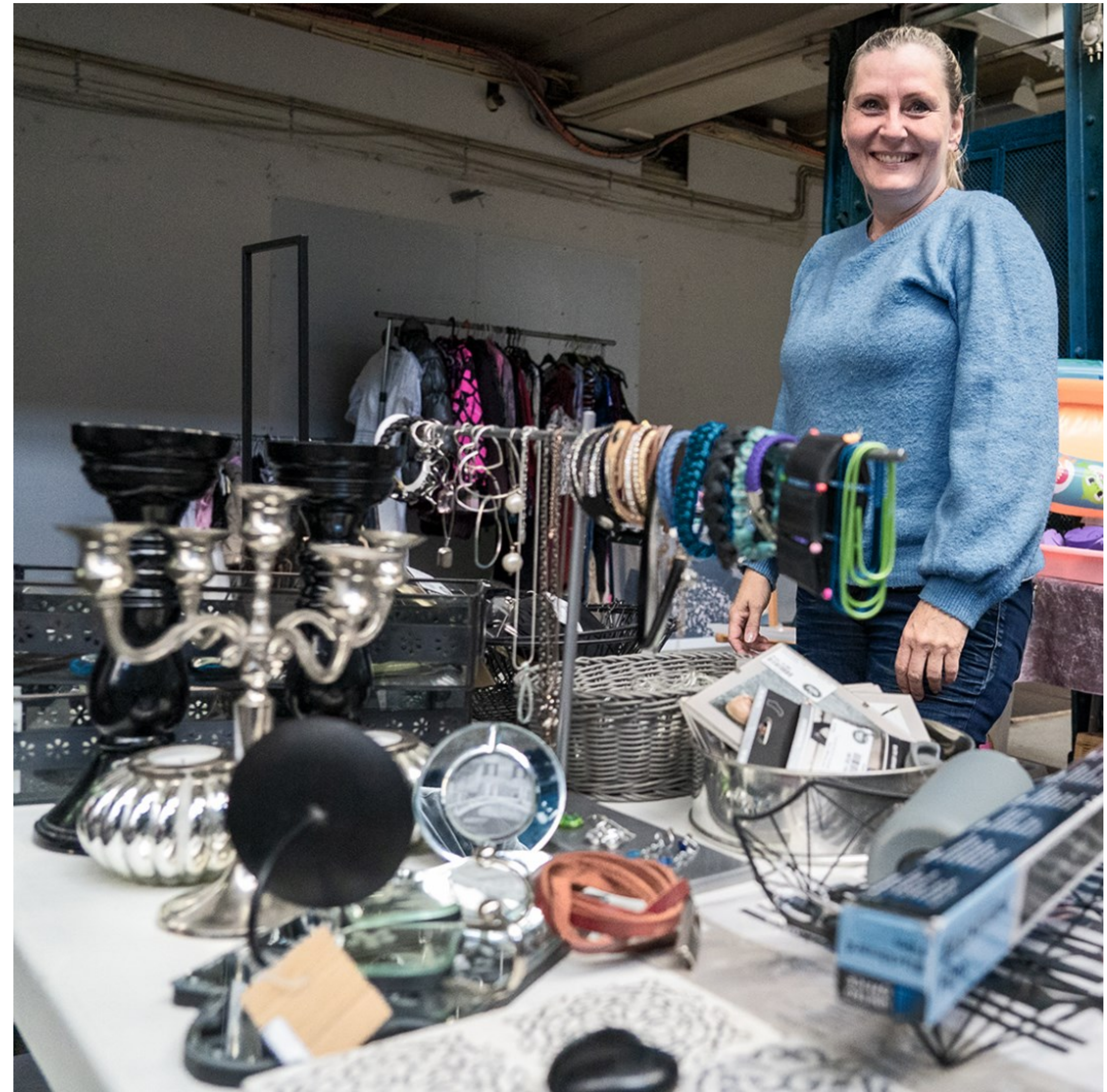
Klar til salg Kl. 18.23.

Forberedelse til Helsingør Loppetorv Værftet den 10.9.2022