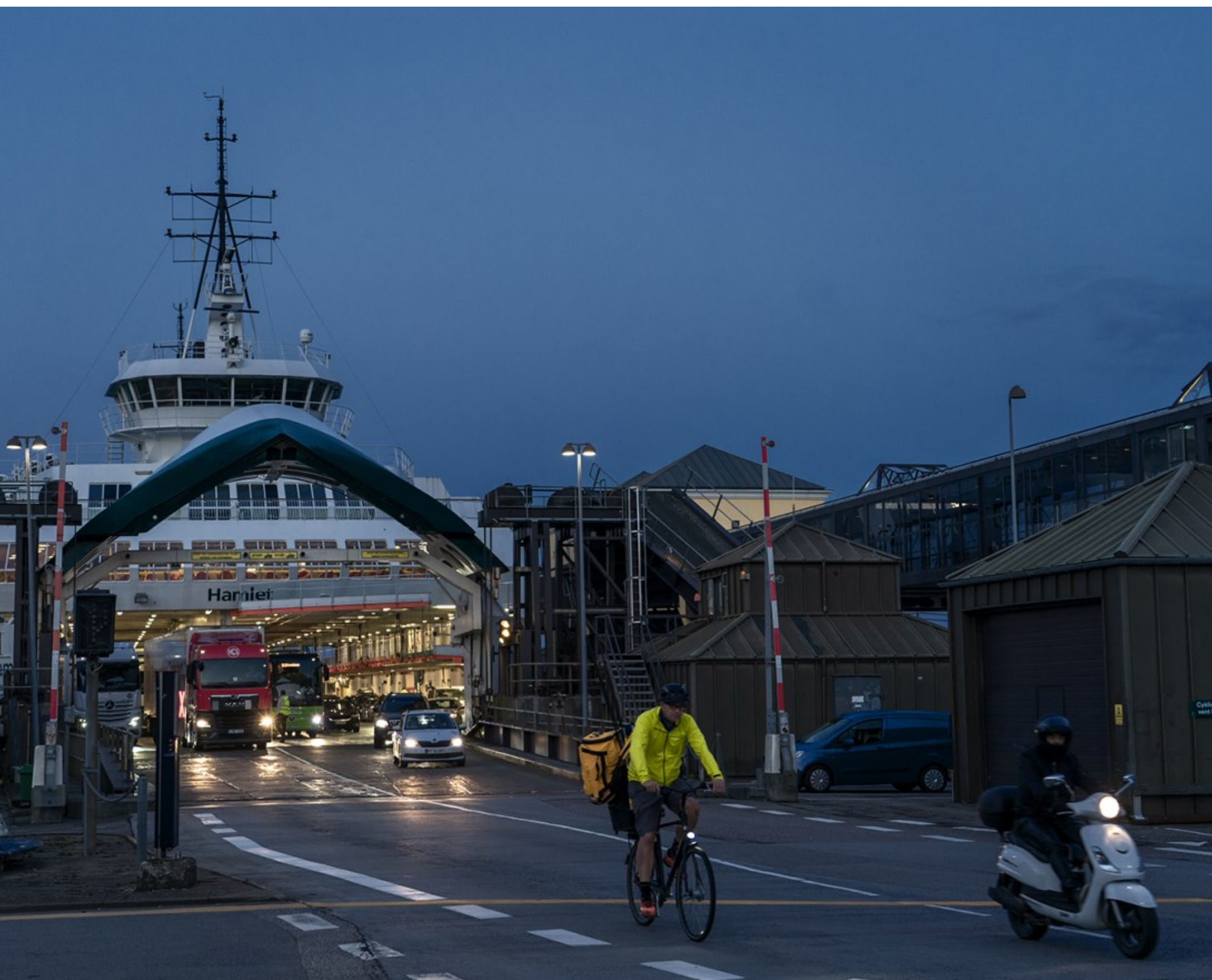
Kl. 19.54.