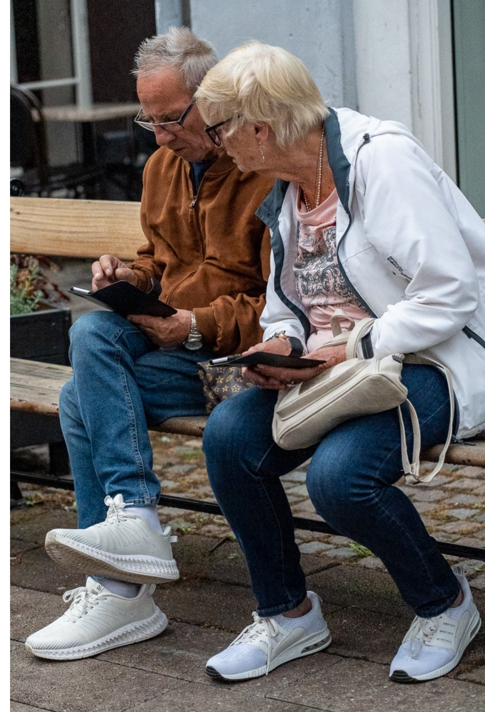
Fandt du det? Turister søger vej. Stengade, Helsingør, KL. 12.21