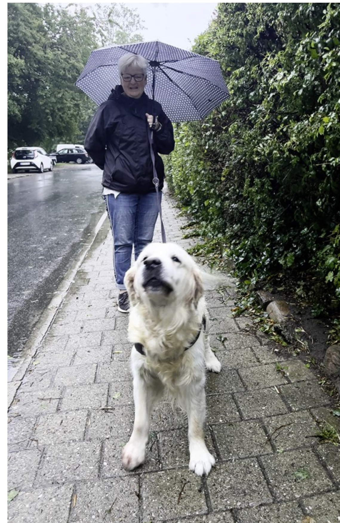
På vej hjem fra første morgentur med hunden. "Hundeprutteposen" er gemt bag ryggen. Søvejen, Helsingør, Kl. 06.52, Foto: Monica Mahona