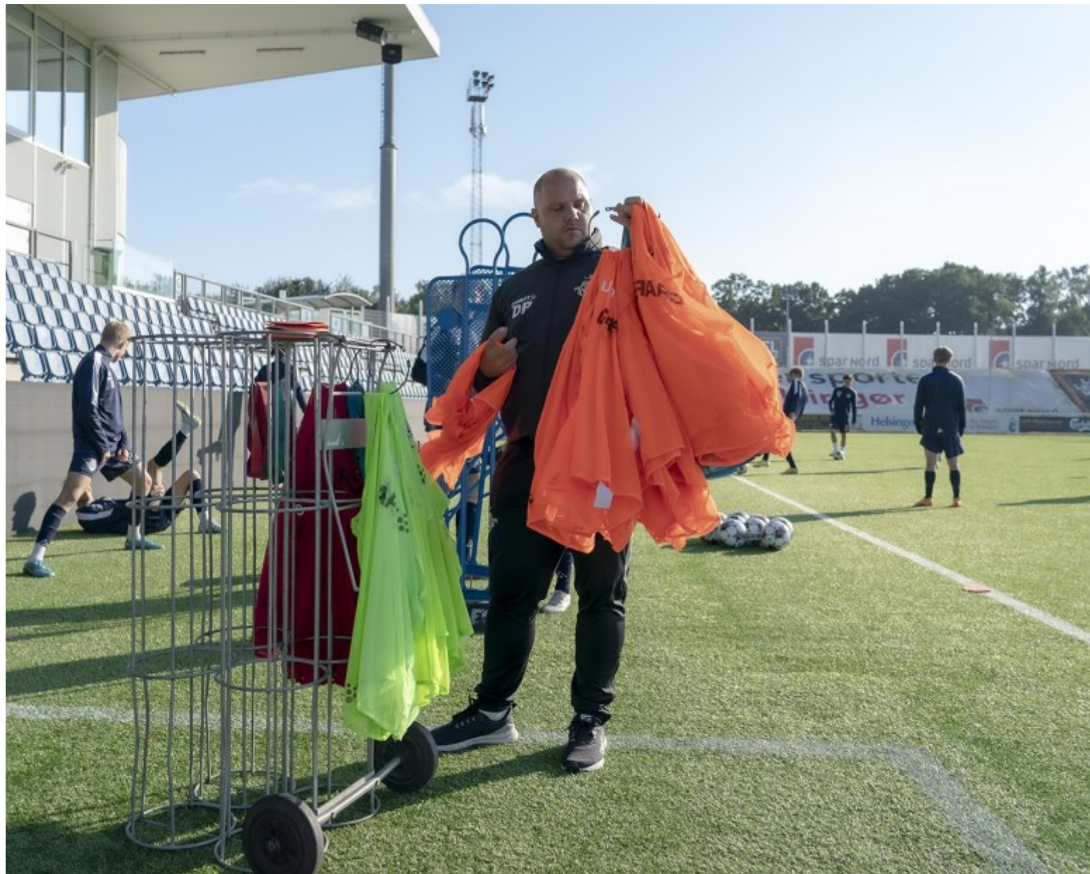
Så kommer vi i gang/ Mål? Helsingør Fodboldklub KL. 17.00 + 17.07