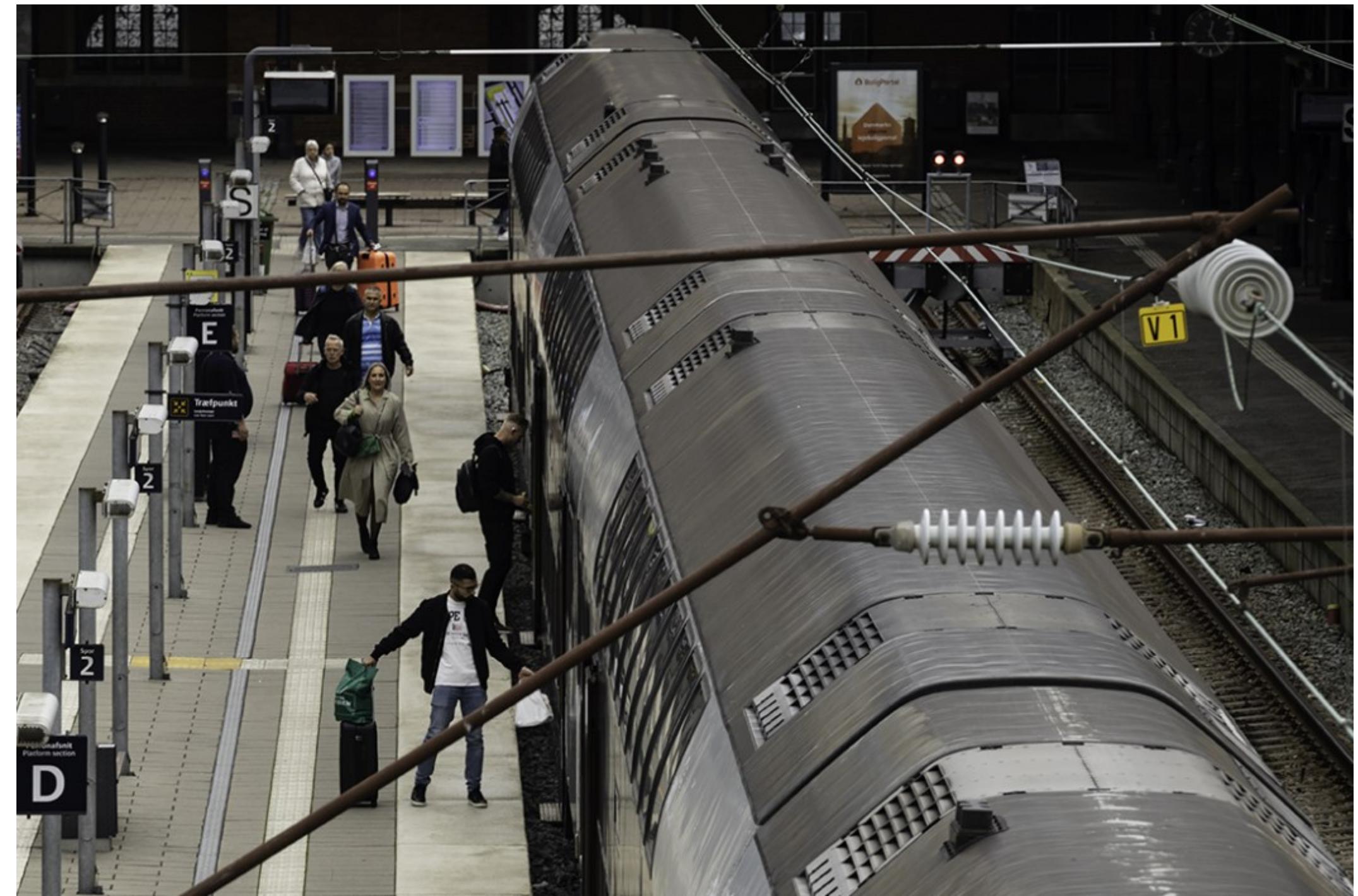
Kl. 11.32.